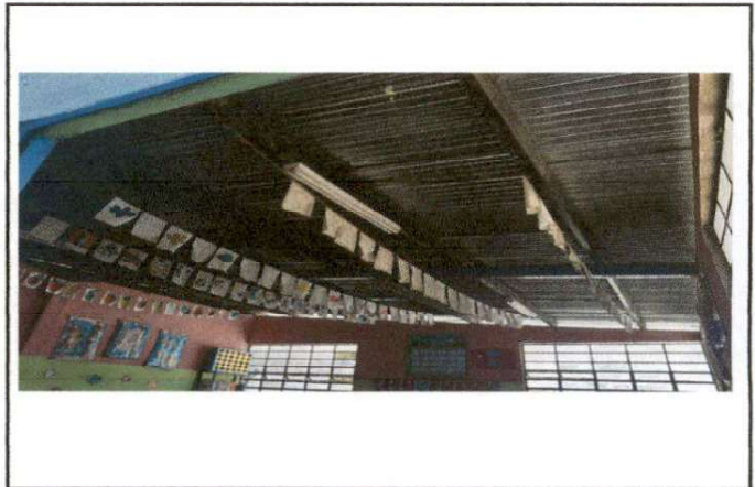
Foto 8: Cambio de lamina por lamina troquelada ya que se encuentra con bastantes agujeros y se mete el agua.