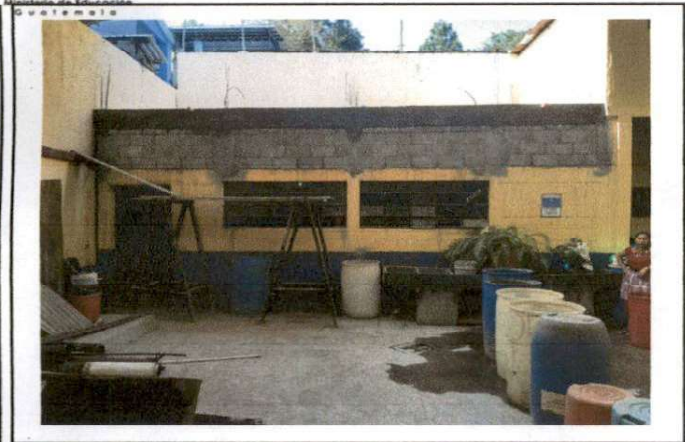
Foto 7: Imagen que muestra el estado actual de puertas y ventanas de la cocina.