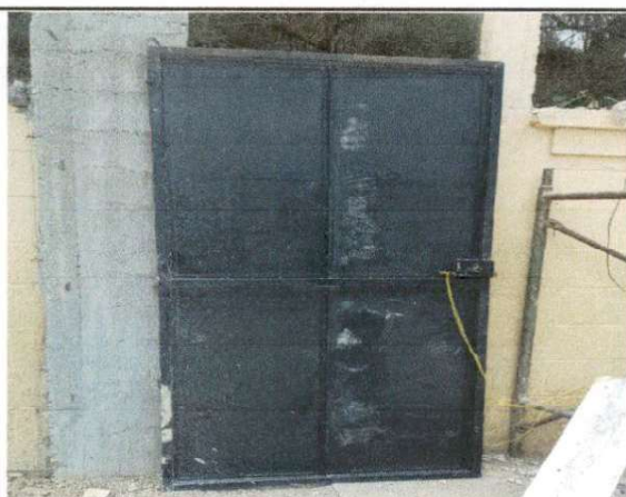
Foto 5: Imagen que muestra el deterioro de las puertas y necesitan mantenimiento.