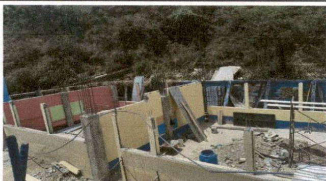
Foto 3: Imagen que muestra que el cableado eléctrico fue quitado debido al cambio de lamina a terraza por lo tanto se tiene que poner nueva electricidad ya que el que tenía no se encuentra en buenas condiciones.