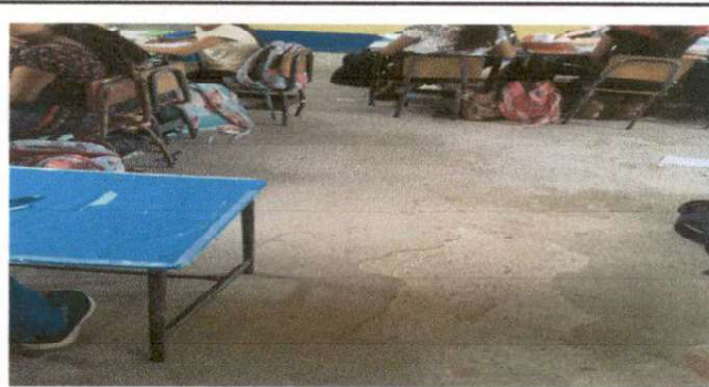
Foto 4: Imagen que muestra el deterioro que tiene la torta de cemento y necesita el cambio a piso cerámico.