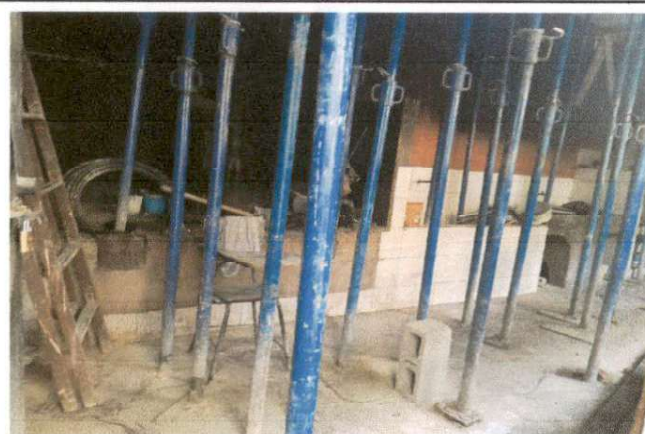
Foto 6: Imagen que muestra el mal estado del pollo y pila de agua de la cocina.