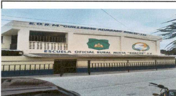
Foto 1: Frente y entrada de la Escuela Oficial Rural Mixta "Guillermo Alvarado Robles" Jornada Matutina