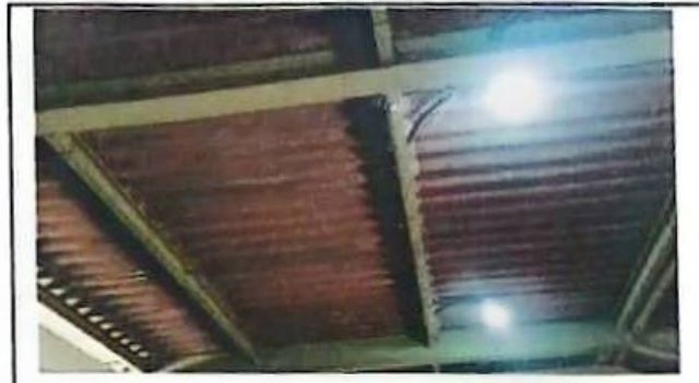
Foto 6: En esta imagen muestra techo con varias grietas en un mismo salón.

Observación: Si es necesario se pueden agregar hojas adicionales y actualizar el Alameda de Hojas.