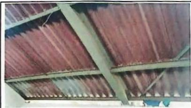
Foto 5: En esta imagen muestra techo con costaneras deterioradas por óxido.