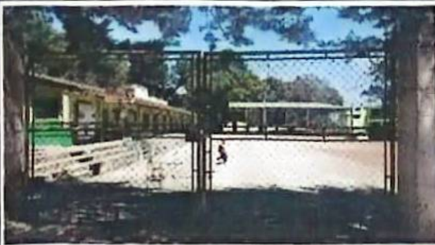
Foto 1: Esta imagen muestra la entrada principal de la escuela Doctora Doris T. Allen J.M con portón de metal y maya con mucho deterioro.