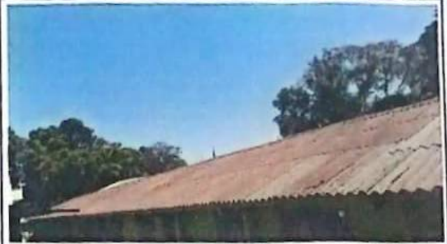
Foto 2: Esta imagen muestra techo de Duralita de los salones del módulo No. 1 con grietas en diversas partes de dicho módulo.