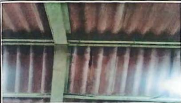
Foto 3: Esta imagen muestra uno de los salones con vista interior, con techo agrietado.