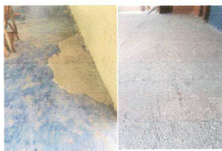
Foto 6: Estado actual del piso en las aulas 1, 2, 3, 5 y corredor.

Observación: Si es necesario se pueden agregar hojas adicionales y actualizar el número de hojas.