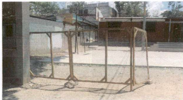
Foto 1: Frente y entrada de la Escuela Oficial Rural Mixta Aldea Estancia Grande JM