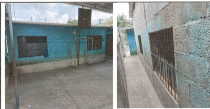
Foto 12: Las ventanas de Segundo primaria están deterioradas, necesitan ser sutituidas por ventanas PVC corredizas.

Observación: Si es necesario se pueden agregar hojas adicionales y actualizar el número de hojas.