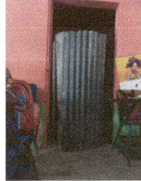
Foto 14: La puerta de lámina de la bodega que tiene ingreso por el aula de cuarto primaria debe ser sustituida por una puerta metálica con chapa.

Observación: Si es necesario se pueden agregar hojas adicionales y actualizar el número de hojas.