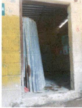
Foto13: La puerta de lámina de la bodega pegada a la cocina necesita sustituirse por una puerta metálica con chapa.