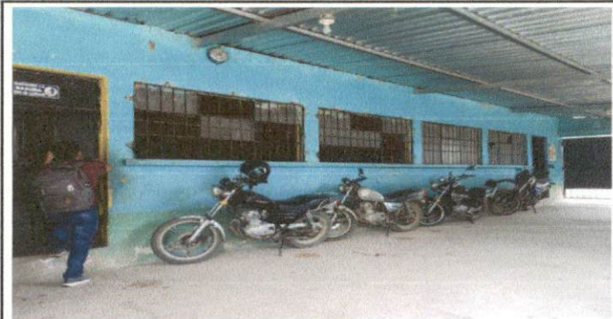
Foto 10: Las ventanas del salón de cuarto primaria y dirección están deterioradas por tener más de 55 años de antigüedad, necesitan ser sutituidas por ventanas PVC corredizas.