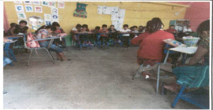
Foto 2: El piso del aula de cuarto primaria no es el adecuado, ya que se encuentra rajado por el paso de los años por lo que se le colocará piso de duela cerámica.