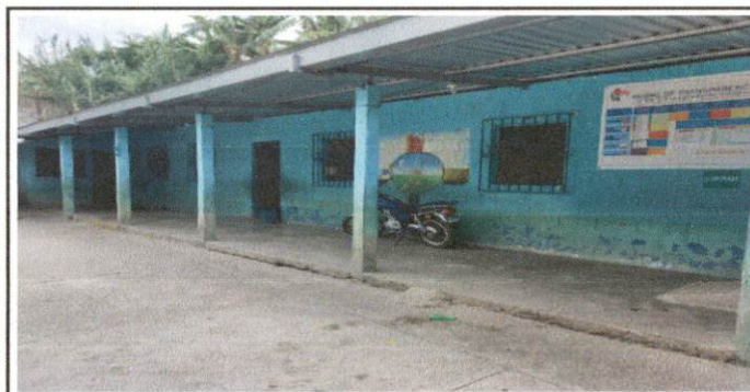
Foto 11: Las ventanas de 1ro, B, tercero y quinto están deterioradas por tener más de 55 años de antigüedad, necesitan ser sutituidas por ventanas PVC corredizas.