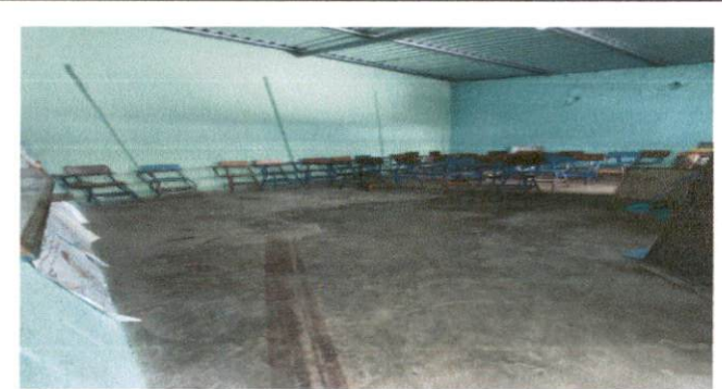
Foto 4: El piso del aula de Tercero primaria no es el adecuado, ya que se encuentra rajado por el paso de los años por lo que se le colocará piso de duela cerámica.