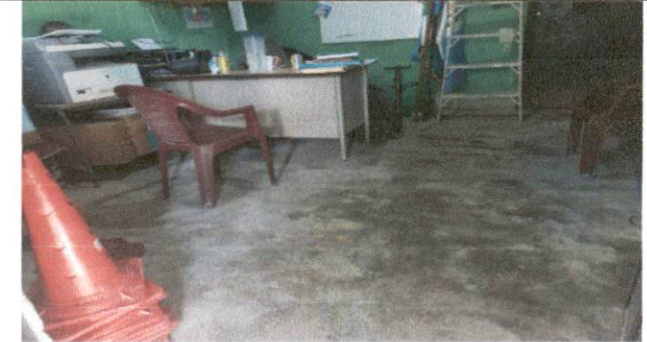
Foto 6: El piso de la dirección del establecimiento se encuentra en mal estado, por lo que se le colocará piso de duela cerámica.

Observación: Si es necesario se pueden agregar hojas adicionales, escribiendo el número de hojas.