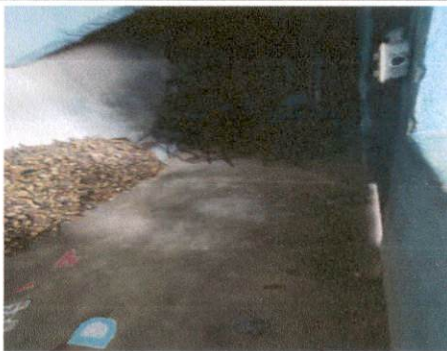
Foto 5: El salón de clases que se utilizaba para primero B, actualmente sin uso, por falta de maestros, tiene el piso en mal estado por lo que se le colocará piso de duela cerámica.