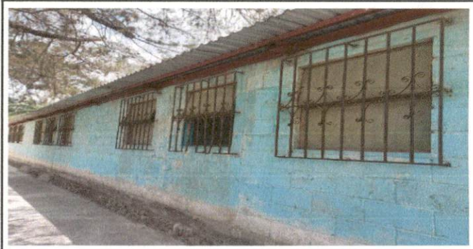
Foto 8: Las ventanas de la parte de atrás de prepa, 1ro., 6to. están deterioradas por tener mas de 55 años den antigüedad, necesitan sustituirse por ventanas de PVC corredizas.