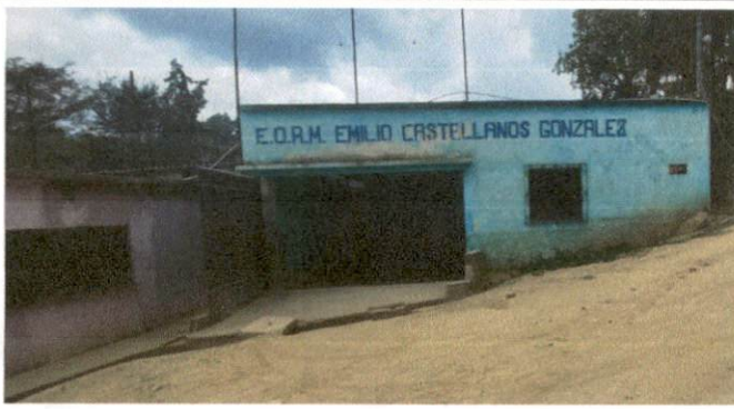
Foto1: Frente del establecimiento. La fachada del establecimiento necesita ser remozada con fachalata lavable para evitar que el polvo la deteriore.