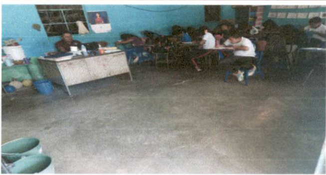
Foto 3: El piso del aula de Quinto primaria no es el adecuado, ya que se encuentra rajado por el paso de los años por lo que se le colocará piso de duela cerámica.