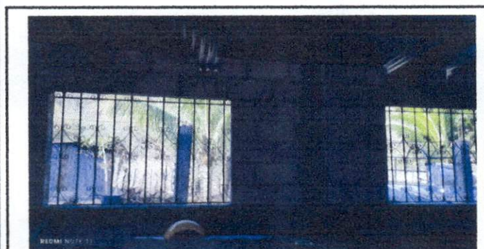
Foto 3: Imagen de las ventanas que solamente tienen balcón y necesitan la estructura de aluminio y vidrios.