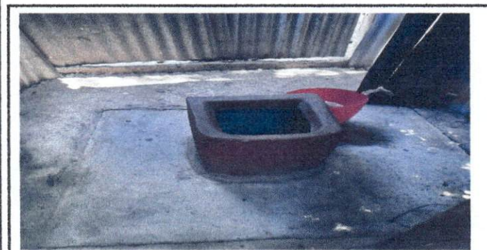
Foto 5 : Imagen que muestra el estado actual de los baños. Se requiere instalación de sanitarios lavables.