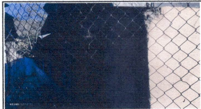
Foto 2: Imagen de atrás de la Escuela que necesita ser repellada.