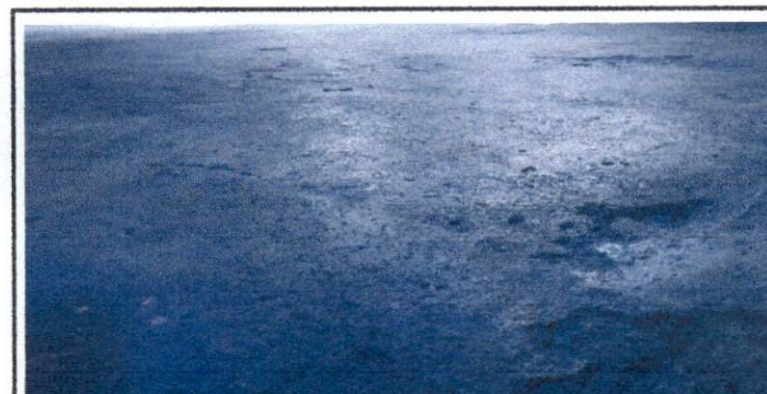
Foto 4 : Imagen que muestran el estado de los pisos de cemento que se encuentran seriamente dañados.