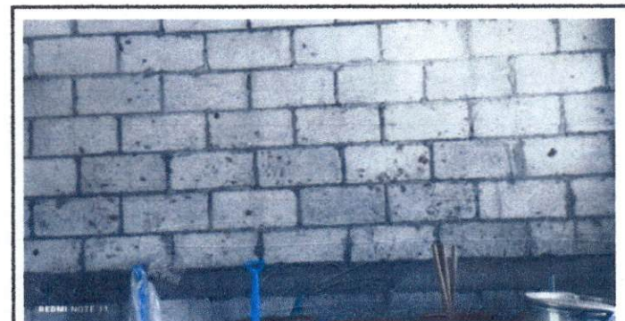
Foto 6: Imagen de las paredes de los salones, no tienen repello y necesitan algunas reparaciones.

Observación: Si es necesario se pueden agregar hojas adicionales y actualizar el número de hojas.