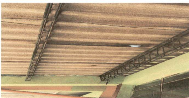
Foto 3: Los techos se encuentran agrietados debido a que tienen de antigüedad, más de 60 años.