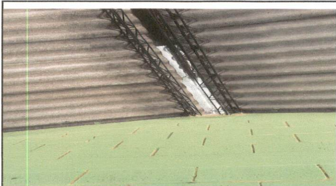
Foto 4: El clima (lluvia extrema) es uno de los factores que mas ha afectado a los niños en sus actividades diarias por la filtración de agua.