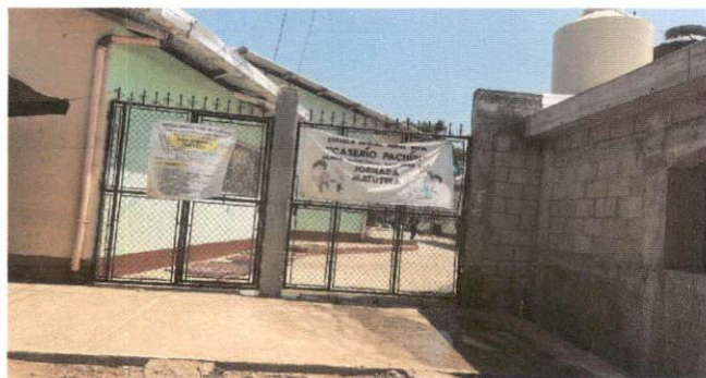
Foto1: Frente y entrada de la EORM Caserío Pachún J.M.