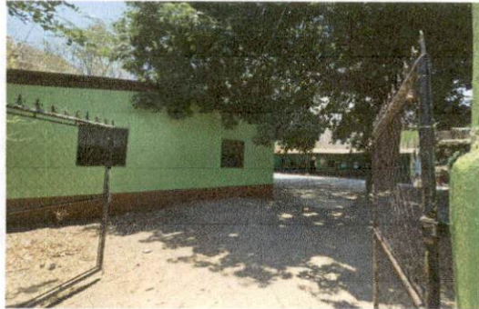
Foto 1: En la imagen se muestra la entrada al establecimiento y al fondo las aulas que necesitan reparaciones.