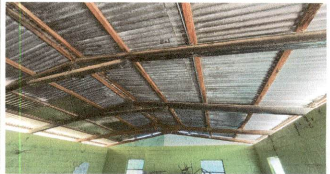
Foto 4: En la imagen se muestran los daños en la bodega, (salón No. 2).