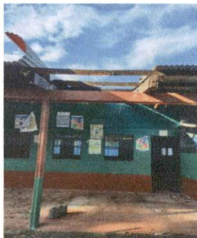
Foto 5: En la imagen se muestra el aula de primero primaria, (salón No. 4)