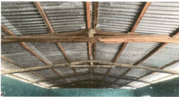
Foto 3: En la imagen se muestran los daños que tiene el salón de preprimaria, (salon No. 1).