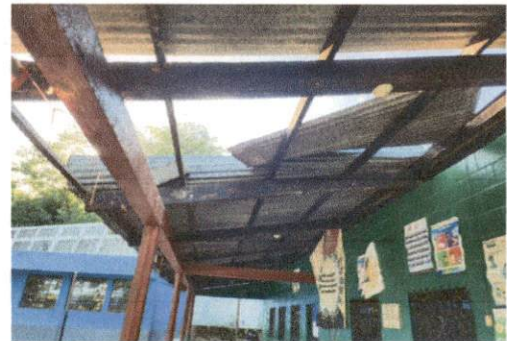
Foto 6: En la imagen se muestran los daños en la dirección, salón de primero y segundo primaria, (salón 3, 4 y 5)

Observación: Si es necesario se pueden agregar hojas adicionales y actualizar el número de hojas.