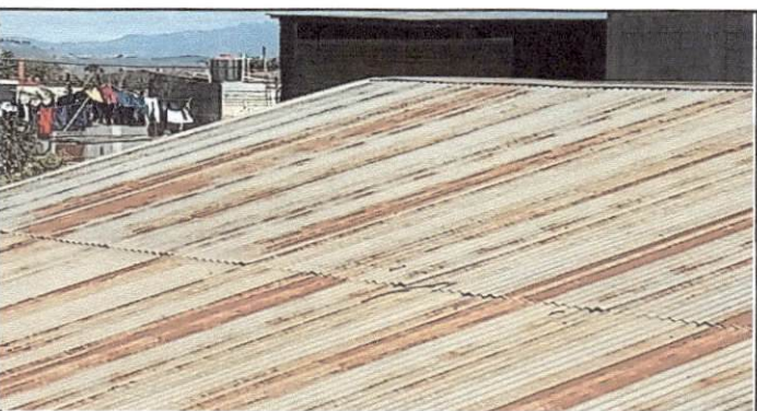
Foto 4: desmontado e instalación de láminas y estructura nueva de 3 aulas del modulo de preprimaria