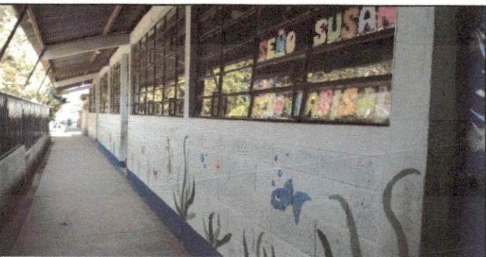
Foto 6: Pintura exterior frontal de 3 aulas módulo de preprimaria

Observación: Si es necesario se pueden agregar hojas adicionales y actualizar el número de hojas.