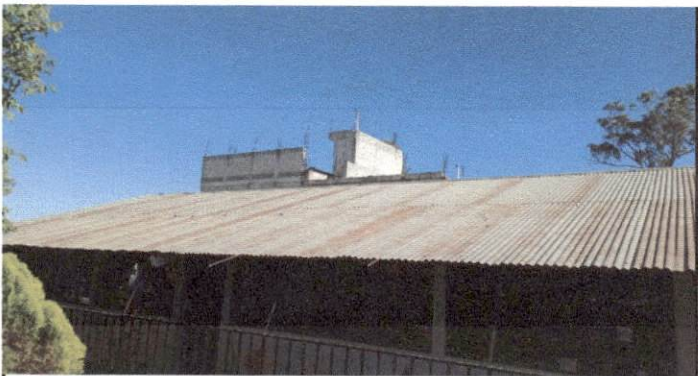
Foto 3: Desmontado e instalación de lámina y estructura nueva de 3 aulas del módulo de preprimaria