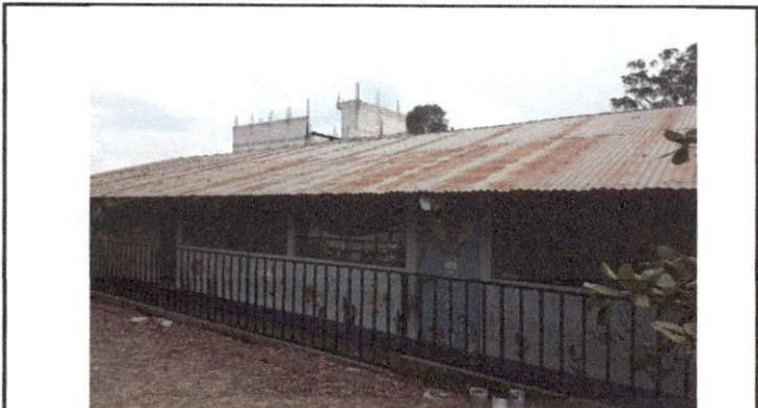
Foto1: desmontado e instalación de lámina y estructura nueva de 3 aulas del módulo de preprimaria