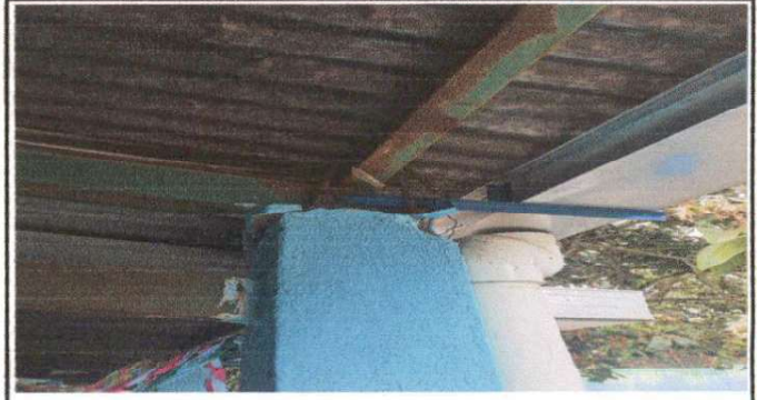
Foto N 2: La estructura metálica de los salones de clase y corredores necesitan mantenimiento para evitar su destrucción.