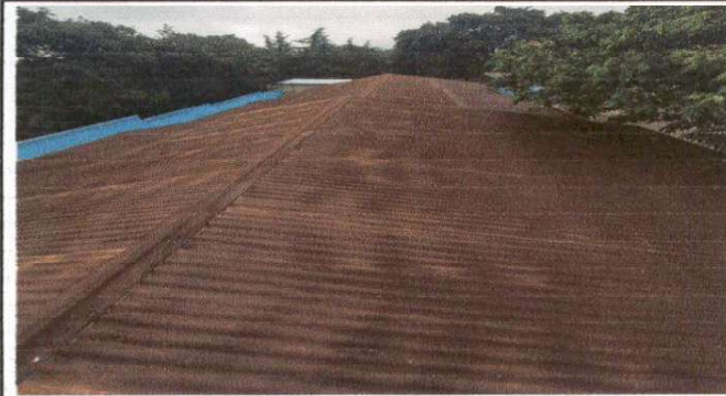
Foto N 1: Las láminas de 6 salones de clase se encuentran en mal estado.