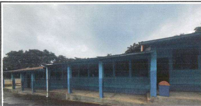
Foto N 5: Salones del lado izquierdo, segundo, cuarto y sexto grado.