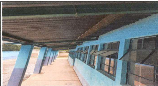
Foto N 3: Área de corredor izquierdo de los salones de clase, su estructura necesita mantenimiento.