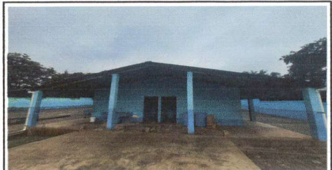
Foto N 6: Área de sanitarios, necesita cambio de láminas y mantenimiento a su estructura de metal.

Observación: Si es necesario se pueden agregar hojas adicionales y actualizar el número de hojas.