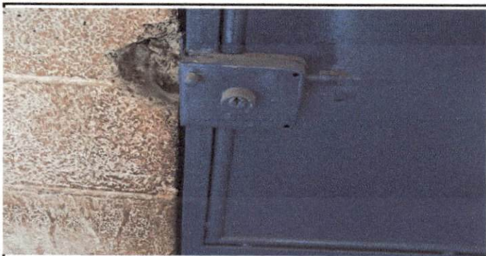
Foto 11: Esta chapa necesita cambio, ya que este ambiente se utilizará para Dirección del establecimiento y la que esta no funciona.