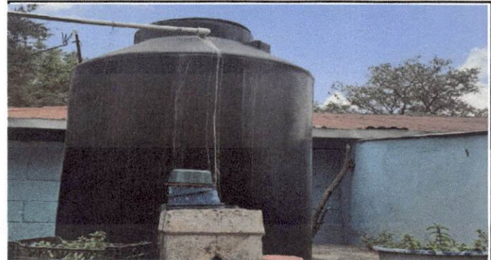
Foto 10: El depósito de agua se encuentra en mal estado y es de muy poca capacidad para cubrir las necesidades del estudiantado.