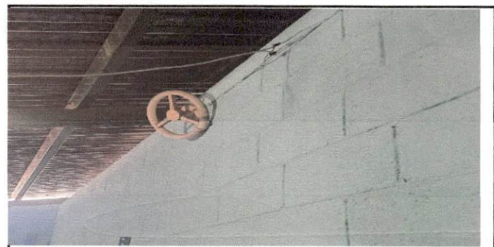
Foto 12: Las luces que se encuentran en algunos salones de clases estan en mal estado o brindan muy poca iluminación.

Observación: Si es necesario se pueden agregar hojas adicionales y actualizar el número de hojas.