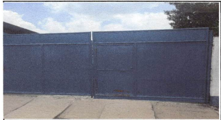
Foto 8: El portón de entrada necesita reparación ya que por la lluvia se esta oxidando de la parte de abajo.