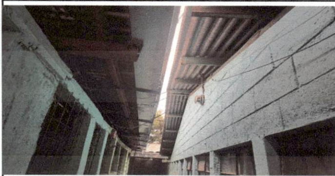
Foto 9: El contador de energía eléctrica se encuentra en la parte de adentro impidiendo la lectura del mismo del lado de afuera, por lo cual es necesario su traslado a la parte exterior del establecimiento.