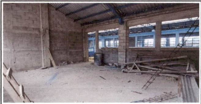
Foto 6: Tallado y alizado de puertas y ventanas de salones del módulo 2 del tercer nivel del Centro Educativo.

Observación: Si es necesario se pueden agregar hojas adicionales y actualizar el número de hojas.