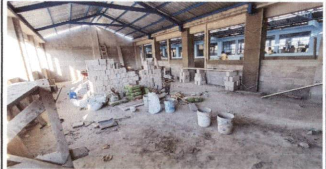
Foto 2: Instalación de Puertas y Ventanas en el salón No. 2 del Módulo 2 del 3er nivel del Centro Educativo.