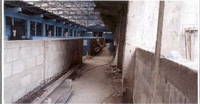
Foto 4: Instalación de piso de granito en el corredor frente a los salones del Módulo 2 del 3er nivel del Centro Educativo.