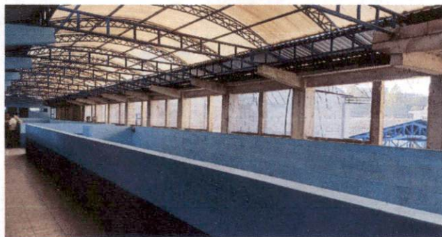
Foto 3: Instalación de Puertas y Ventanas en salón 1 al 5 del módulo 2 del tercer nivel del Centro Educativo.