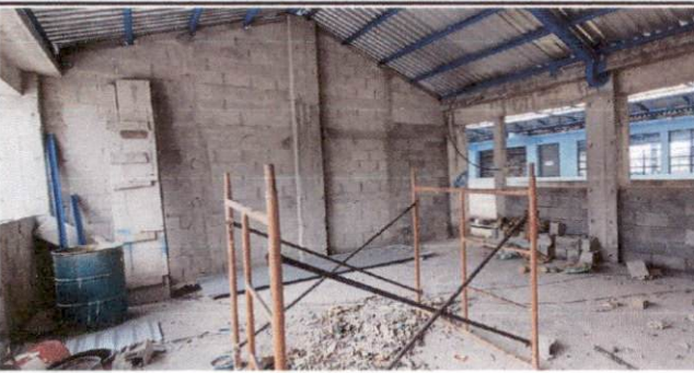
Foto 5: Tallado y alizado de columnas y soleras de salones del módulo 2 del tercer nivel del Centro Educativo