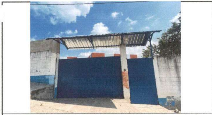
Foto 5: Estructura de techo, Mantenimiento a estructura de soporte de metal