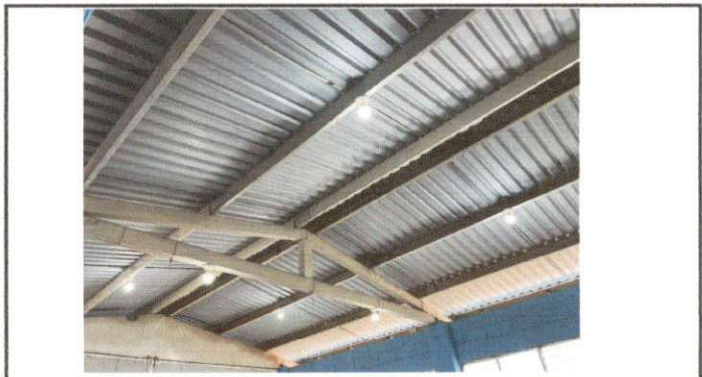
Foto 4: Reparación de sistema eléctrico, Reparación de cableado eléctrico.