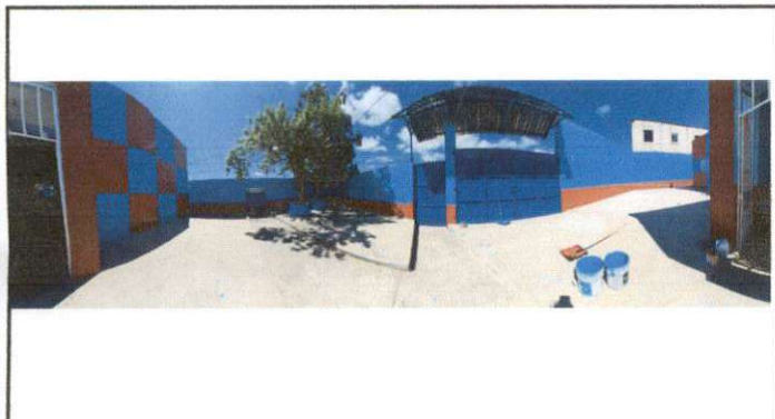
Foto 3: Losa de patio, Reparación de planchas de concreto de patio.