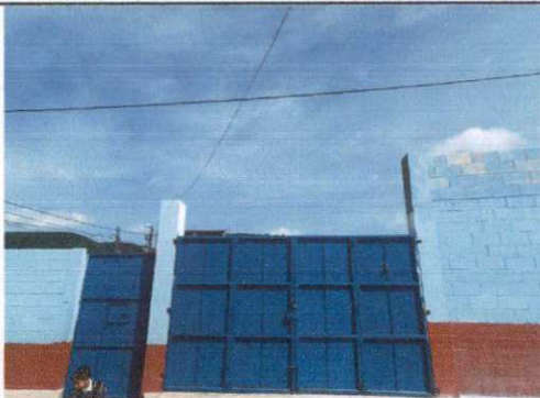
Foto 5: Estructura de techo, Mantenimiento a estructura de soporte de metal