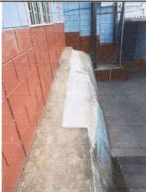
Foto 3: Losa de patio, Reparación de planchas de concreto de patio.