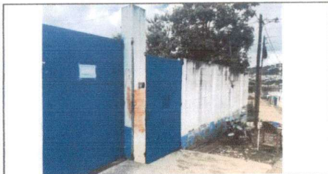
Foto 5: Estructura de techo, Mantenimiento a estructura de soporte de metal