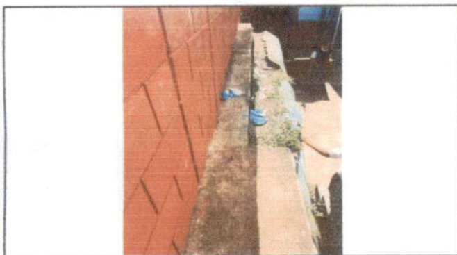
Foto 3: Losa de patio, Reparación de planchas de concreto de patio.