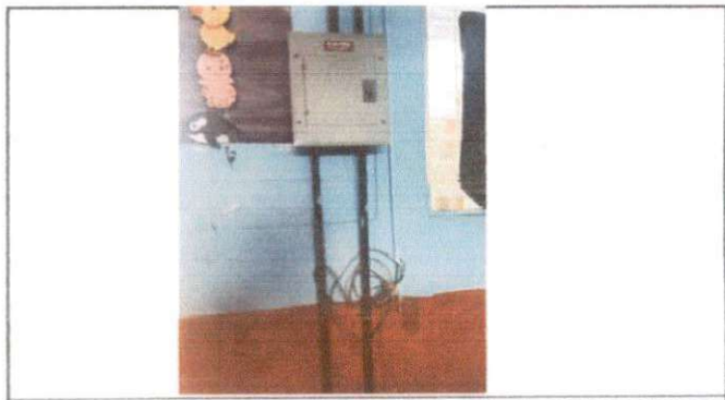
Foto 4: Reparación de sistema eléctrico, Reparación de cableado eléctrico.