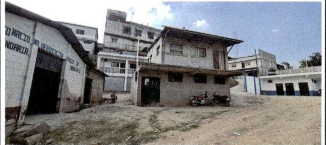
Foto 4: Laboratorio de computación y bodega en segundo nivel del I.N.E.B Telesecundaria Cerro Alto.