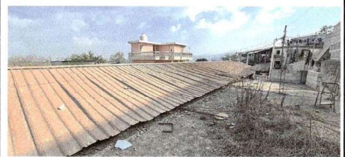
Foto 6: En el segundo nivel de la dirección se contempla terminar la cocina del establecimiento del I.N.E.B Telesecundaria Cerro Alto.

Observación: Si es necesario se pueden agregar hojas adicionales y actualizar el número de hojas.