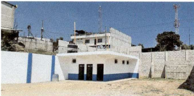
Foto 3: Servicios sanitarios nuevos I.N.E.B Telesecundaria Cerro Alto.