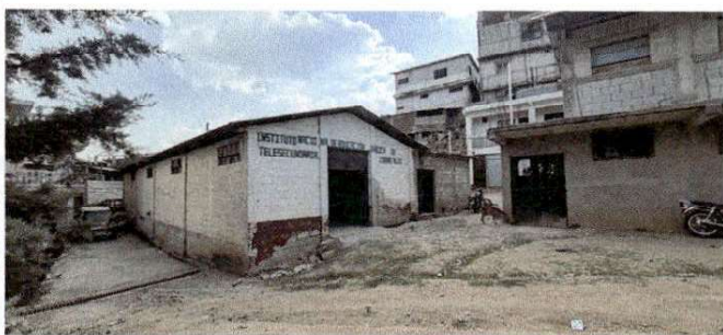
Foto 5: Salón de usos múltiples y dirección del I.N.E.B Telesecundaria Cerro Alto.