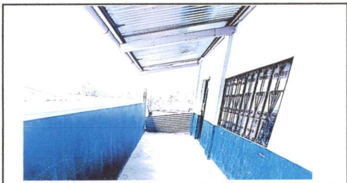
Foto 5: Imagen del pasillo y el fin de las aulas dejando al descubierto el segundo nivel y provocar accidentes.