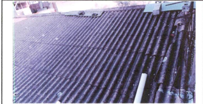
Foto 2: Imagen parte superior del techo de duralita Aulas 1 y 2, este techo es sumamente peligroso en un terremoto, en esos salones se alberga a primero Primaria en la mañana y primero Básico en la tarde.