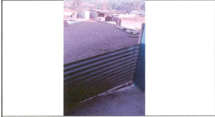
Foto 4: Imagen que muestra que al terminar el ultima aula del segundo nivel, no hay división, solo una lamina que separa el fin de la construcción. lo que puede provocar accidentes que los estudiantes.