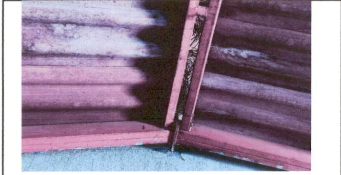
Foto 1: Imagen que muestra el techo de duralita de hace mas 60 años del Aula 1 al igual que el Aula 2; tambien tiene la misma clase de techo el cual se desea sustituir por lámina troquelada Aluzinc No.26.