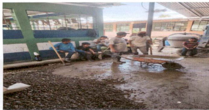
Foto 3: PREPARACIÓN DE CONCRETO PARA FUNDICIÓN DE TORTA EN SALÓN 4