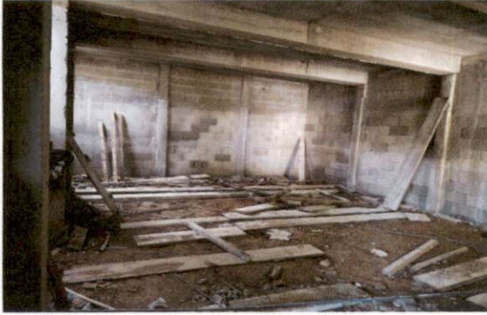
Foto 1: PREPARACIÓN DE TIERRA COMPACTADA PARA TORTA DE CONCRETO DE SALÓN 4