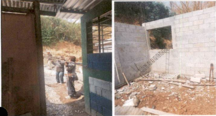
Foto1: ARMADURA DE COLUMNAS PARA LOZA DE SALÓN 4