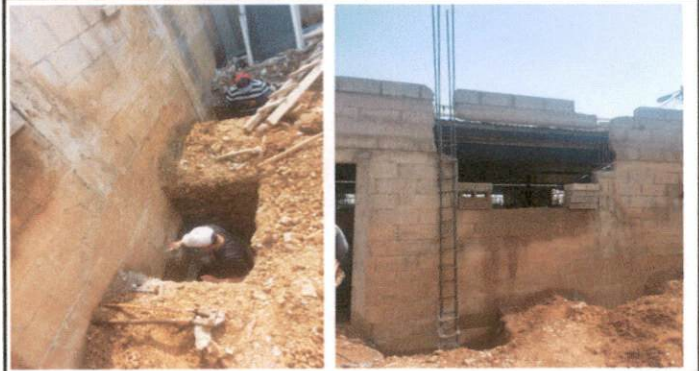
Foto 2: EXCAVACIÓN DE ZAPATA PARA COLOCAR COLUMNAS DE REFUERZO PARA LOZA EN EL SALÓN 4