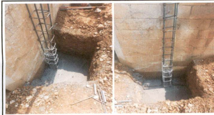
Foto 3: FUNDICIÓN DE ZAPATAS Y COLOCACIÓN DE ARMADURA PARA COLUMNAS EN EL SALÓN 4