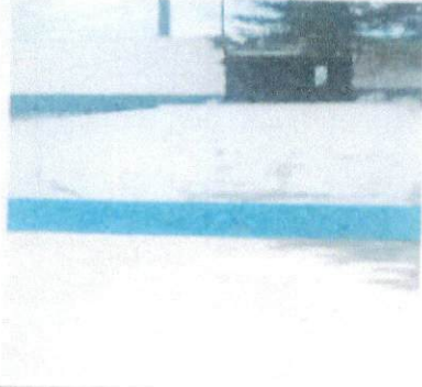
foto 1 esta imagen muestra el muro a remozar