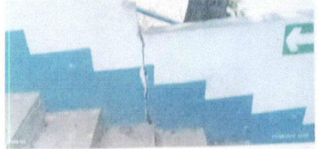
foto 2 esta imagen muestra el peligro que representa en las futuras lluvias, si el muro no se repara