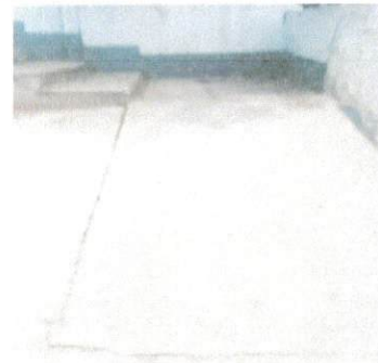
foto 4 esta imagen las gradas agrietadas por el peso del muro a remozar.