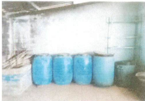
foto 5 esta imagen muestra la estufa a remozar.