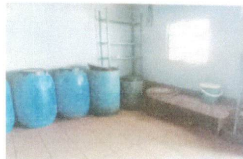
foto 6 esta imagen muestra en donde se sustituirá los visto por la mesa gabetero azulejado

Observación: Si es necesario se pueden agregar hojas adicionales y actualizar el número de hojas.