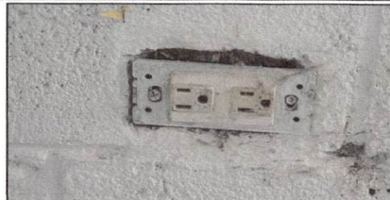
Foto 8: Sustitución de tomacorrientes e interruptores en salones 1, 2, 3, 4, 5, 6, 7 y en dirección.