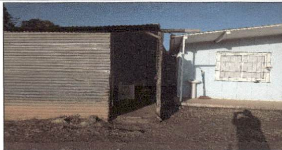
Foto 2: Reparación de paredes completando el muro que hace falta para así evitar accidentes con los estudiantes.