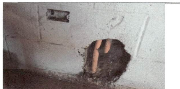
Foto 10: Reparación y mantenimiento de tuberías y cables expuestos del salón 5 y 6.