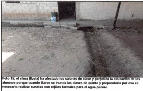
Foto 15: el clima (luvia) ha afectado los salones de clase y perjudica la educación de los alumnos porque cuando llueve se inunda las clases de quinto y preparatoria por eso es necesario realizar cunetas con rejillas formales para el agua pluvial.

Observación: Si es necesario se pueden agregar hojas adicionales y actualizar el número de hojas.