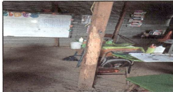
Foto 4: Reparación de paredes, instalación de costaneras ya que se encuentra en mal estado los paraleles que contiene y se pone en riesgo la integridad de los alumnos por lo consiguiente creemos necesario remozar el aula y bodega a la vez para que los alumnos y los insumos de arañidad estén resguardados en un lugar seguro.