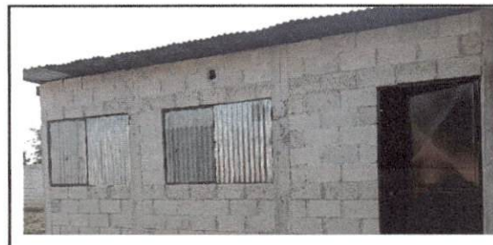
Foto 6: continuidad de la instalación y mantenimiento de canal para bajada de agua.

Observación: Si es necesario se pueden agregar hojas adicionales y actualizar el número de hojas.