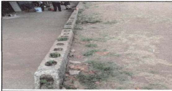
Foto 13: Continuidad de cuneta concreto con rejilla de metal para agua pluvial