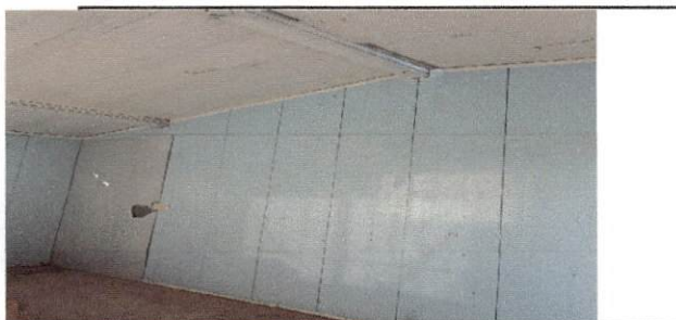
Foto 3: Se necesita realizar un polleton para la realización de la alimentación escolar ya que solamente contruyeron el cajon para cocina pero no hay enseres para la realización de los mismos.