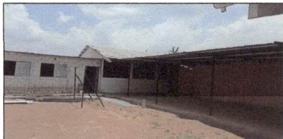
Foto 5: Instalación y mantenimiento de canal para bajada de agua pluvial aluzink ya que en epoca de invierno se inundan los salones 4,5 y 6.