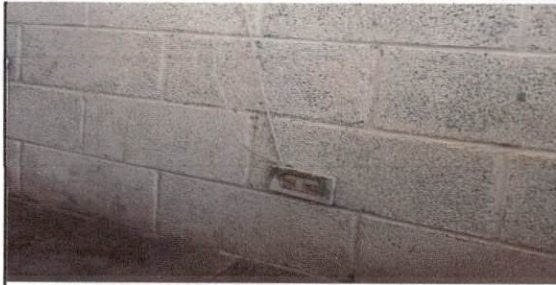
Foto7: sustitución de cableado electrico en dirección, salón 1, 2, 3, 4, 5, 6, 7.