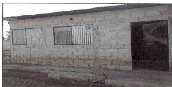
Foto 12: Continuidad de mantenimiento de cuneta de concreto con rejilla de metal para agua pluvial.

Observación: Si es necesario se pueden agregar hojas adicionales y actualizar el número de hojas.