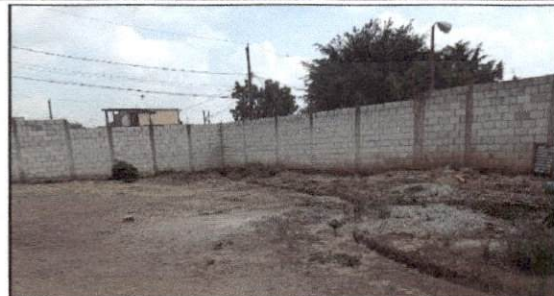
Foto 14: reparación y mantenimiento de cuneta de concreto con rejilla de metal para agua pluvial 77 metros.