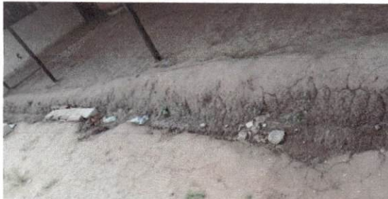
Foto 11: Remozamiento de cuneta para agua pluvial con instalación de rejilla de metal.