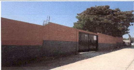
Foto1: Frente y entrada de la EODP ANEXA A EORM CIUDAD GÓTICA