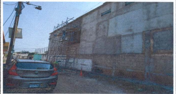
Foto 2: Pared de saiones de clases que necesitaba repello area exterior .