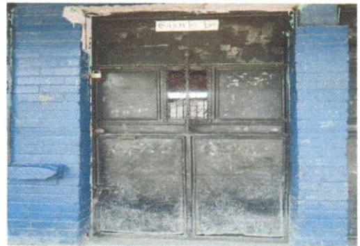
Foto 2: Imagen que muestra el estado de las puertas del establecimiento