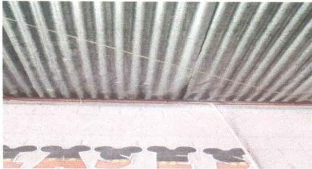
Foto1: Imagen que muestra parte de la lámina del salón de clases No. 1 que va a ser sustituida