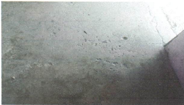
Foto 3: Imagen que muestra el estado de los pisos de torta de concreto.