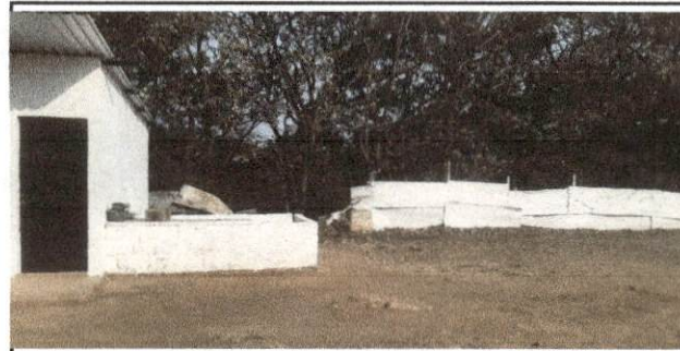
SE COLOCARÁ PISO CERÁMICO ANTIDESLIZANTE E LA COCINA

Observación: Si es necesario se pueden agregar hojas adicionales y actualizar el número de hojas.