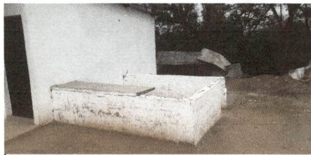
FOTO 4 LA COCINA NECESITA PINTURA Y AZULEJOS