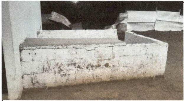
FOTO 3 ASPECTO DE LA PARTE DE ENFRETE DEL LA COCINA LA CUAL YA PRESENTA MUCHO DETERIORO