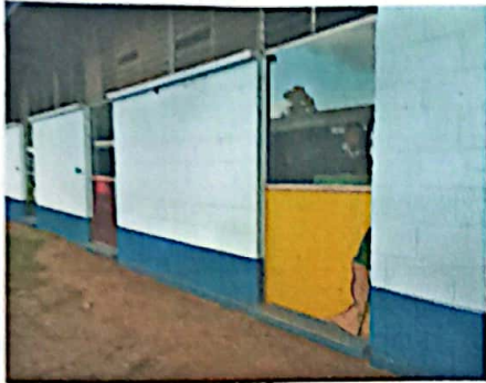
Foto No. 7 Corresponde a vidrio que se va a sustituir en salón de clases.