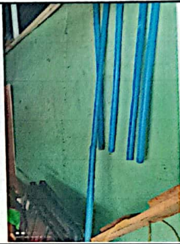
Foto No. 4 donde se sustituirá un muro de madera por uno de block en el área de Dirección y Bodega.