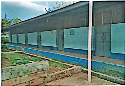
Foto No. 9 Módulo en donde se les dará servicio y mantenimiento a las puertas metálica.