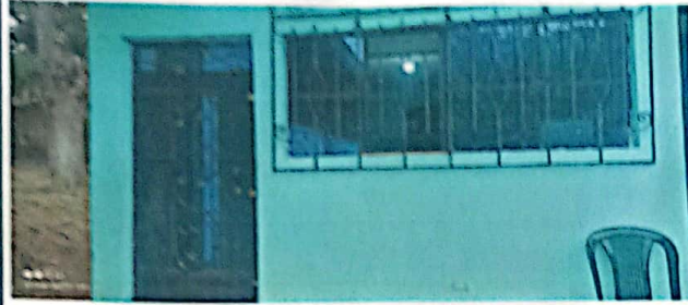
Foto No. 1 Corresponde a la Dirección en donde se le dará mantenimiento a dos puertas y 4 balcones