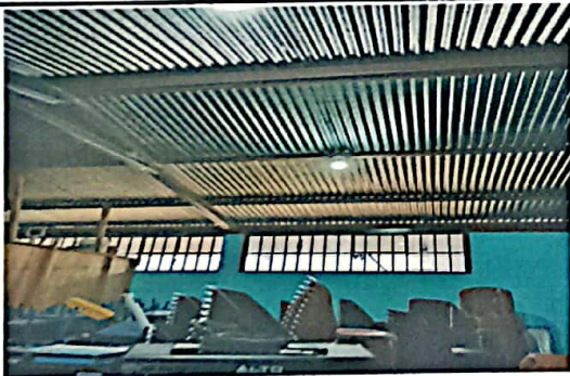
Foto No. 11 Corresponde al salón donde se colocará cielo falso.