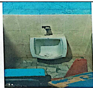
Foto No. 6 Reparación de un migitorio en servicio sanitarios.

Observación: Si es necesario se pueden agregar hojas adicionales y actualizar el número de hojas.