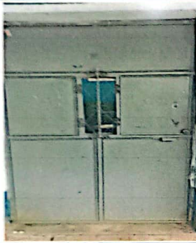
Foto No. 3 Puerta que será sustituida por una nueva por su deterioro.