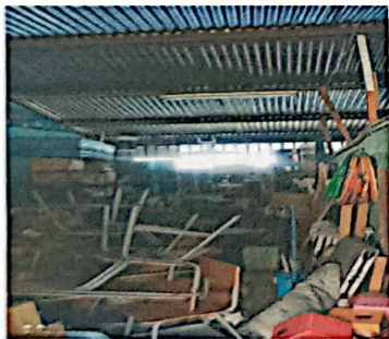
Foto No. 5 Ampliación de techo en el área de bodega con soporte de metal y gradas metálicas.