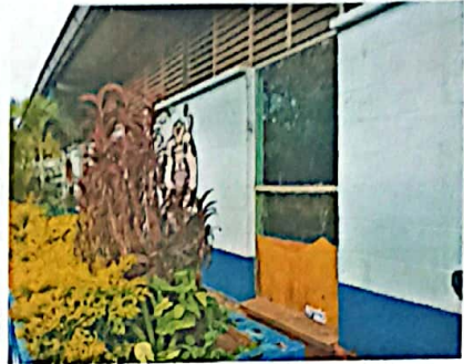
Foto No. 8 Corresponde a vidrio a sustituir en un segundo salón de clases.