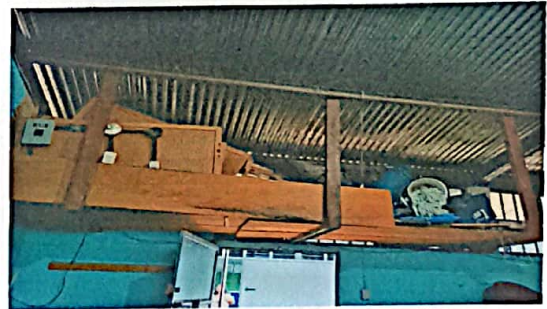
Foto No. 12 Ampliación de techo en área de bodega con soporte de metal y entrepiso de madera.

Observación: Si es necesario se pueden agregar hojas adicionales y actualizar el número de hojas.