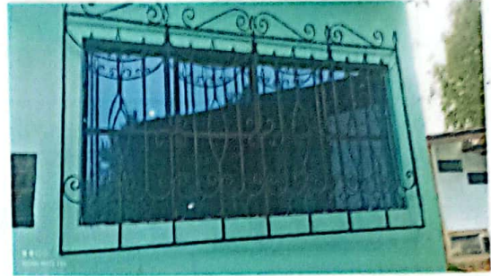
Foto No. 2 Corresponde a los balcones que se les dará mantenimiento en el módulo de Dirección.