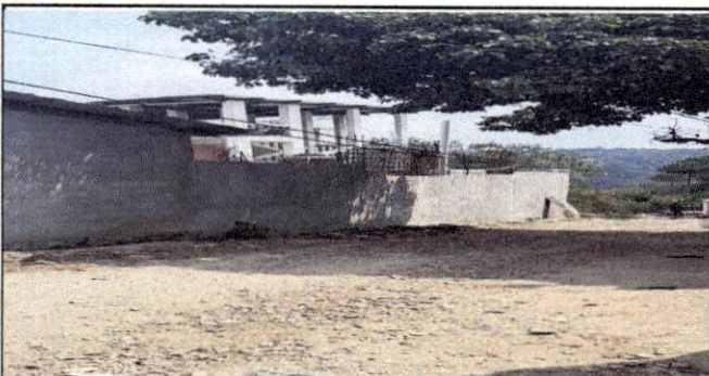
Foto 5: Vista del área de ampliación de la cocina desde la parte de afuera del lado derecho de la calle.