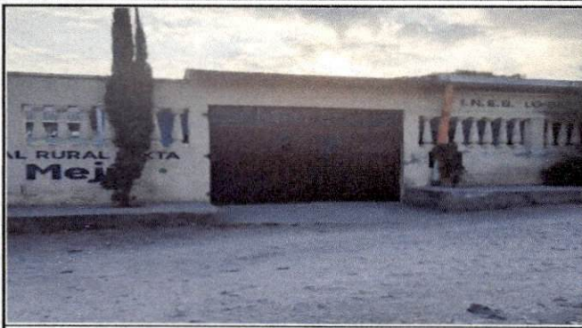
Foto 1: Frente y entrada del Instituto Nacional de Educación Básica, Lo de Mejia