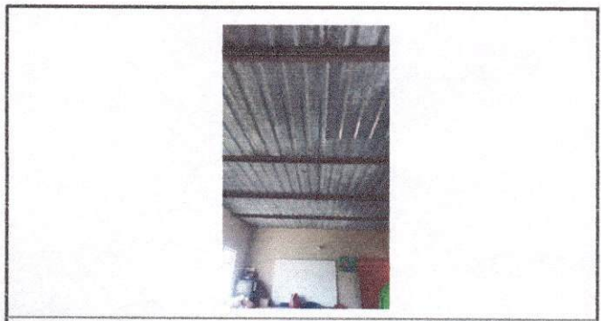
Foto 6: la otra parte del techo que se sustituirá para colocar la losa

Observación: Si es necesario se pueden agregar hojas adicionales y actualizar el número de