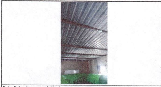
Foto 5: la otra parte del techo que se sustituirá para colocar la losa