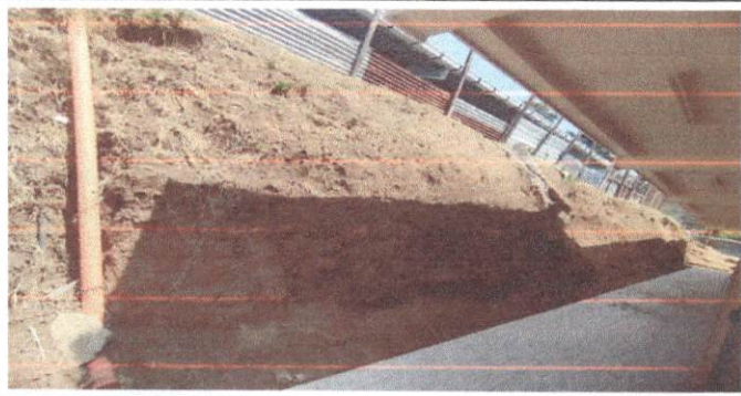
Foto 5: Vista frontal del área donde se hará el levantado del muro perimetral