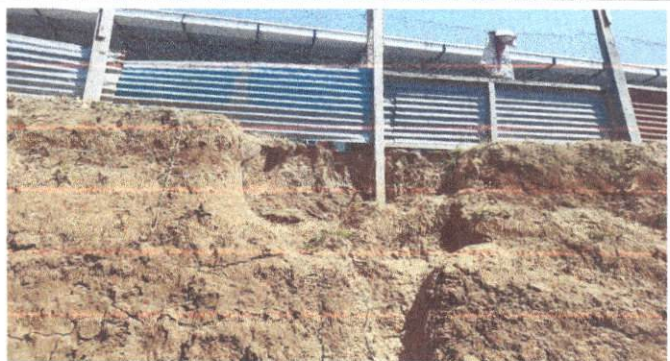
Foto 4: Area de peligro para los alumnos de Preprimaria de nuestra escuela.