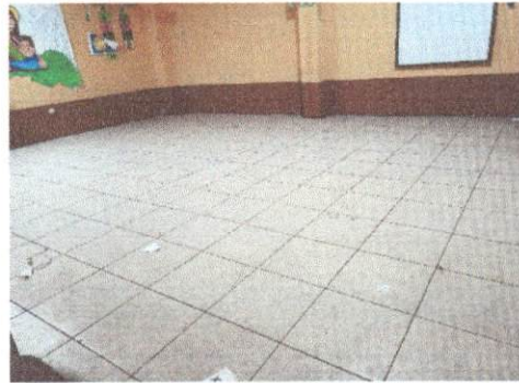
Foto 2: Trabajo finalizado de la sustitución de torta de cemento por piso cerámico en el salón de Preprimaria.