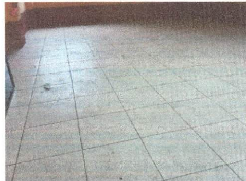
Foto 6: Trabajo finalizado de la sustitución de torta de cemento por piso cerámico en el salón de Sexto Primaria.

Observación: Si es necesario se pueden agregar hojas adicionales y actualizar el número de hojas.