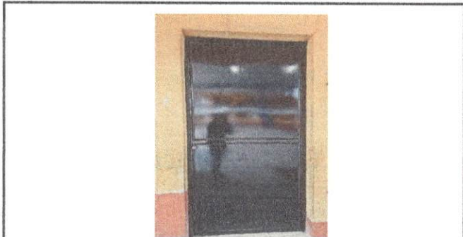
Foto 11: Trabajo finalizado del mantenimiento de puerta del salón de Cuarto Primaria