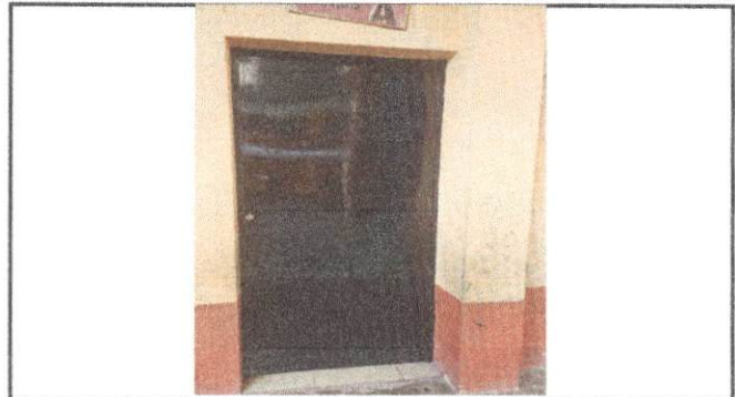
Foto 8: Trabajo finalizado del mantenimiento de puerta del salón de preprimaria.