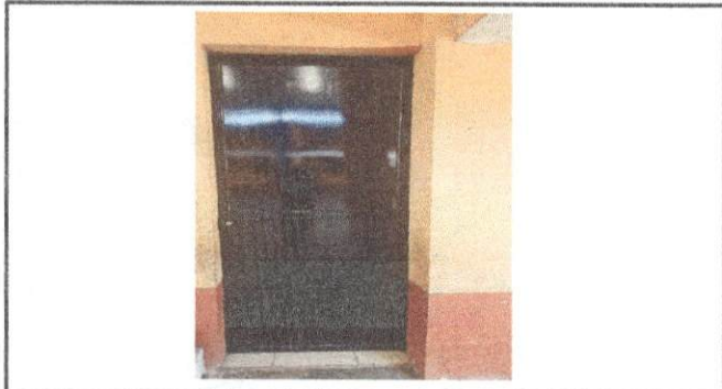
Foto 9: Trabajo finalizado del mantenimiento de puerta del salón de Segundo Primaria.