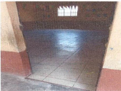
Foto 3: Trabajo finalizado de la sustitución de torta de cemento por piso cerámico en el salón de Segundo Primaria.