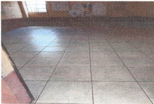
Foto 5: Trabajo finalizado de la sustitución de torta de cemento por piso cerámico en el salón de Cuarto Primaria.