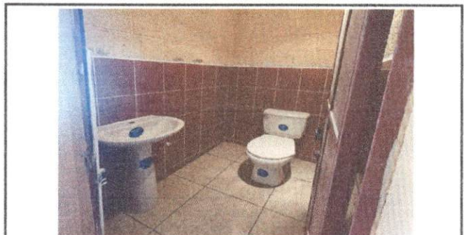
Foto 12: Trabajo finalizado de cambio de azulejo, piso y accesorios de 2 sanitarios de docentes.

Observación: Si es necesario se pueden agregar hojas adicionales y actualizar el número de hojas.