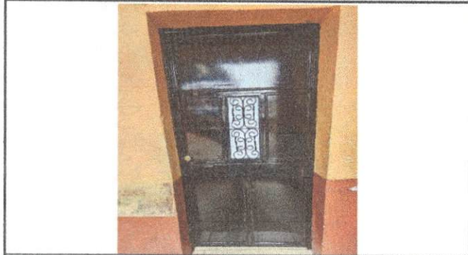
Foto 7: Trabajo finalizado del mantenimiento de puerta de un salón que ocupa la dirección.