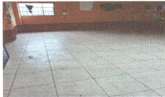
Foto 4: Trabajo finalizado de la sustitución de torta de cemento por piso cerámico en el salón Tercero Primaria.