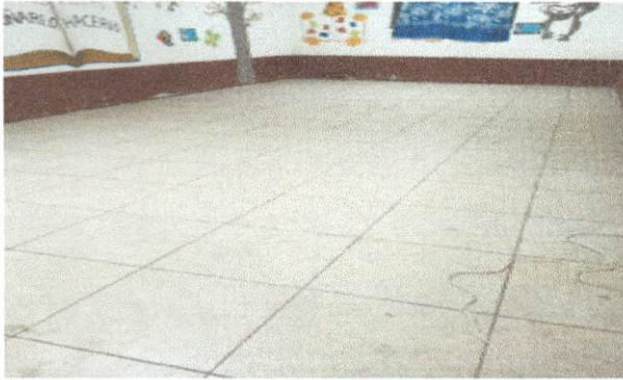
Foto 1: Trabajo finalizado de la sustitución de torta de cemento por piso cerámico en un salón que ocupa la Dirección.