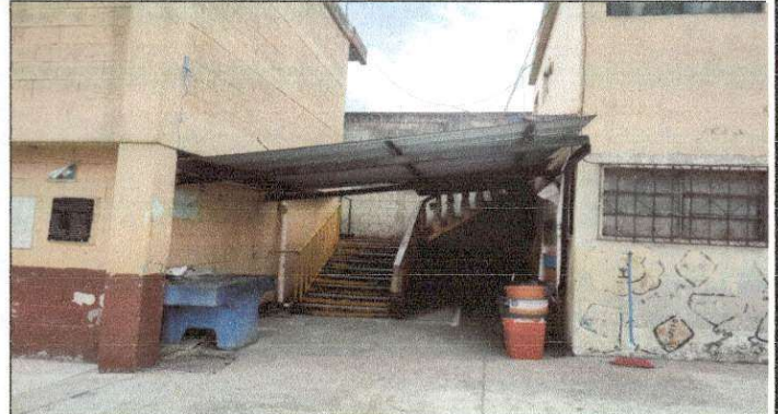
Foto 2: Sustitución de tubería pvc, línea principal aguas pluviales