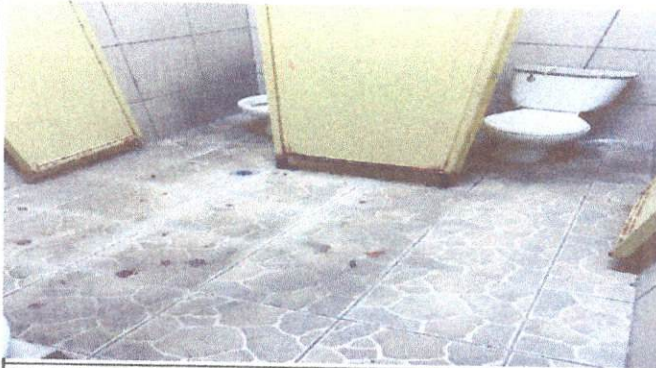
Foto 3: Cambio de Sanitarios la mayoría de hinodoros se encuentran en mal estado los cuales deben ser cambiados y remozados