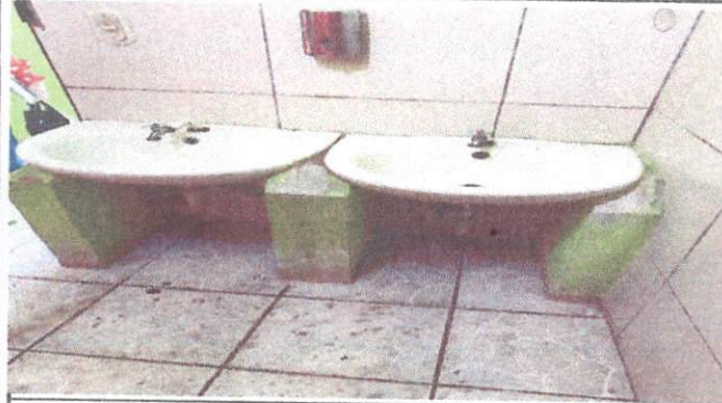
Foto1: Cambio de lavamanos todos los lavamanos de los Sanitarios de la Escuelase cambiaran ya que se encuentran en mal estado