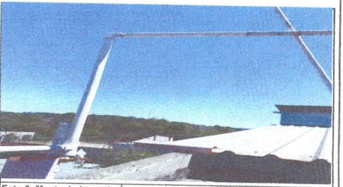
Foto 6: Mantenimiento de Área con deposito, se remozara todo el sistema de agua del establecimiento

Observación: Si es necesario se pueden agregar fotos adicionales, numerar el número de hojas.