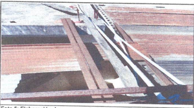
Foto 5: Elaboración de una pasarela de metal se remozara el techo y se colocara una pasarela de metal para poder llegar a los techos