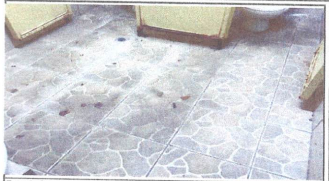
Foto 2: Cambio y colocación de piso y azulejos en los Sanitarios ya que se encuentran manchados, necesitan ser sustituidos y otros sanitarios no tienen azulejos