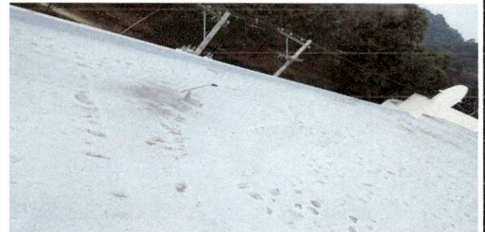
FOTO 6: Reparación de bajada de agua pluvial, tubo 3"; impermeabilización de losa.

Observación: Si es necesario se pueden agregar hojas adicionales y actualizar el número de hojas.