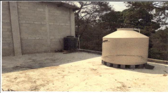
Foto 3: área donde será fabricada e instalada la puerta en módulos.