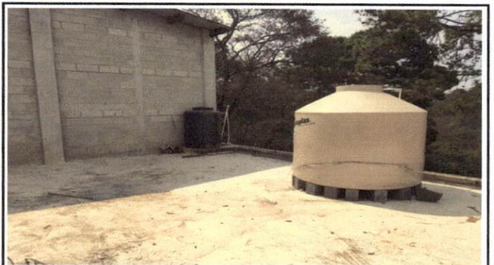
Foto 4: Depósitos de agua que deben ser movidos para fabricar e instalar las ventanas.