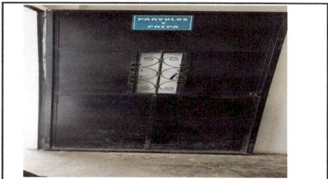
Foto 4: Puertas ya deterioradas, imagen que muestra el estado actual de las puertas