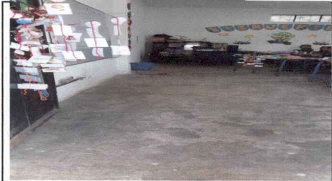
Foto1: Aula de preprimaria con piso de cemento