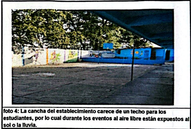
foto 4: La cancha del establecimiento carece de un techo para los estudiantes, por lo cual durante los eventos al aire libre están expuestos al sol o la lluvia.