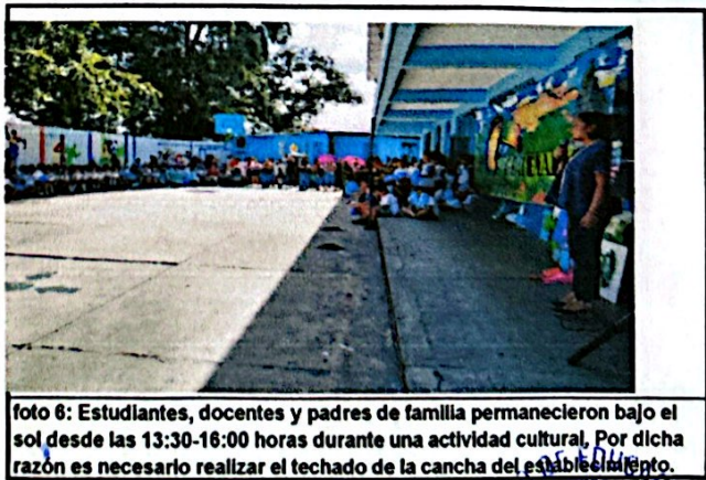
foto 6: Estudiantes, docentes y padres de familia permanecieron bajo el sol desde las 13:30-16:00 horas durante una actividad cultural, Por dicha razón es necesario realizar el techado de la cancha del establecimiento.

Observación: Si es necesario se pueden agregar hojas adicionales y actualizar el número de hojas.