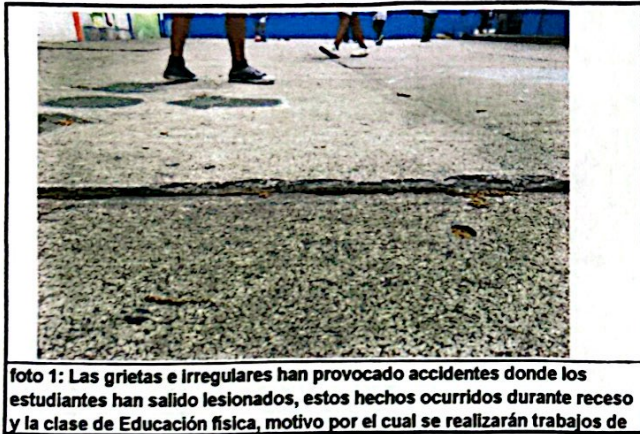
foto 3: Las grietas e irregulares han provocado accidentes donde los estudiantes han salido lesionados, estos hechos ocurridos durante receso y la clase de Educación física, motivo por el cual se realizarán trabajos de