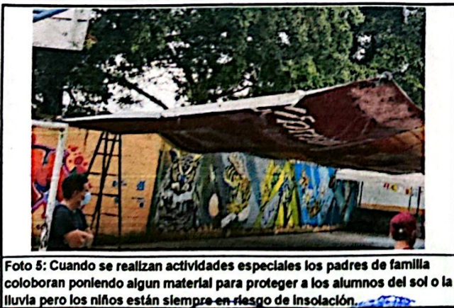
Foto 5: Cuando se realizan actividades especiales los padres de familia colaboran poniendo algún material para proteger a los alumnos del sol o la lluvia pero los niños están siempre en riesgo de insolación.