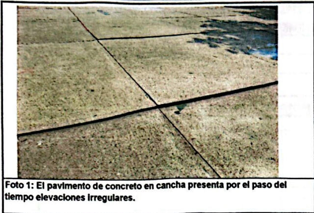
Foto 1: El pavimento de concreto en cancha presenta por el paso del tiempo elevaciones Irregulares.