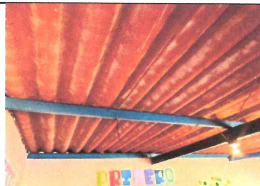
Foto 4: Duralita en techo del salón C la cual presenta marcas de humedad, además se deberá realizar el cambio de instalación eléctrica.