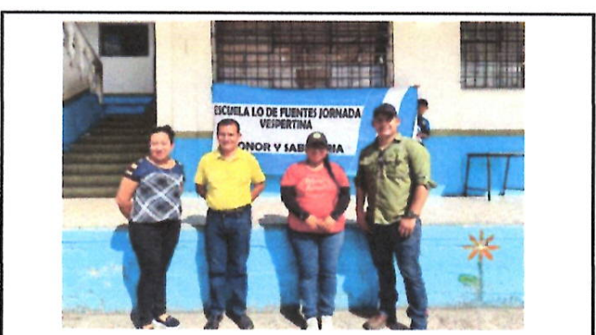
Foto 12: Fotografía con director y OPF, al terminar la visita de campo.