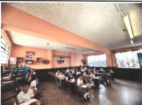
Foto 5: Salones del Módulo A los con sistema eléctrico deficiente.