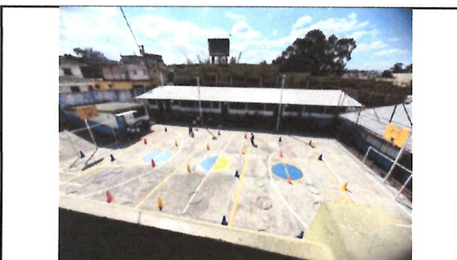
Foto 9: Actualmente los niños no cuentan con un espacio con sombra para poder desarrollar las actividades físicas.