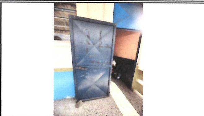
Foto 7: Puertas deterioradas por las condiciones climáticas y la falta de mantenimiento.