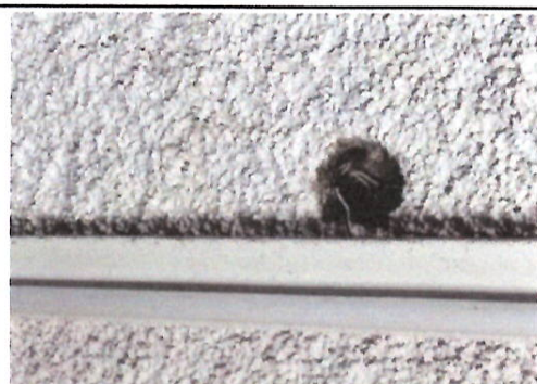
Foto 6: Se muestran las conexiones en el Módulo A , debido a la mala calidad, provoca que se generen variaciones en el voltaje que dañan las lámparas