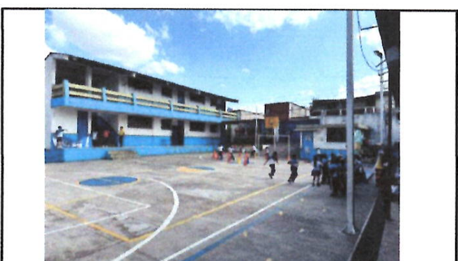
Foto 10: Se aprecia a los niños realizando actividades en el calor del medio día, lo que ha provocado problemas de deshidratación y desmayos.