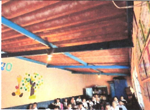
Foto 1: . El Salón aún cuenta con techo de duralita, el cual se encuentra dañado por el paso del tiempo.