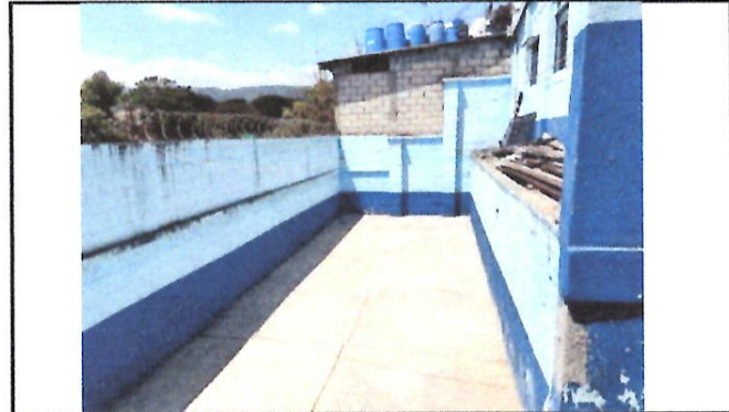
Foto 10: Espacio recreativo para niños de preprimaria, el cuál en temporada de lluvia no se puede utilizar.