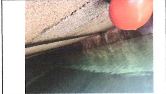
Foto 8: Debido a que la losa del cisterna es prefabricada, presenta problemas de deflexión por lo que representa riesgo para los niños.