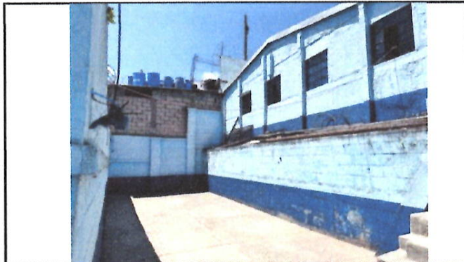
Foto 9: Tomando en cuenta que el patio que se observa es el único en el cual los niños pueden desempeñar sus actividades recreativas y el calor es muy intenso, se propone realizar el techado del mismo.