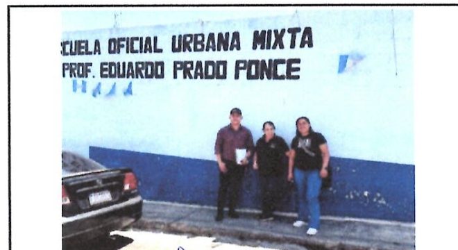
Foto 12: Fotografía con directora y OPF, al terminar la visita de campo.