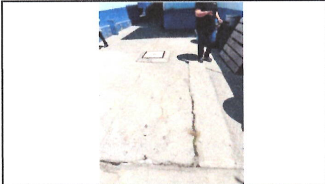
Foto 7: El cisterna presenta problemas de filtración y fuga, por lo que se pretende realizar el mantenimiento del mismo.