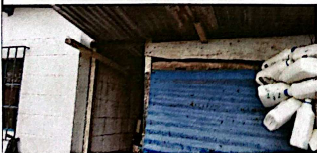
INSTALACION DE MESON DE COCINA