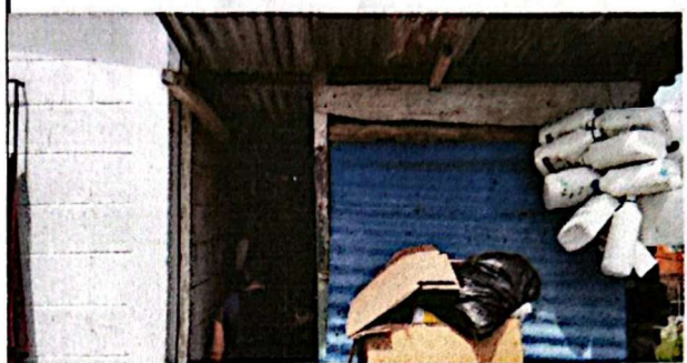
SUMINISTRO E INSTALACION DE TECHO