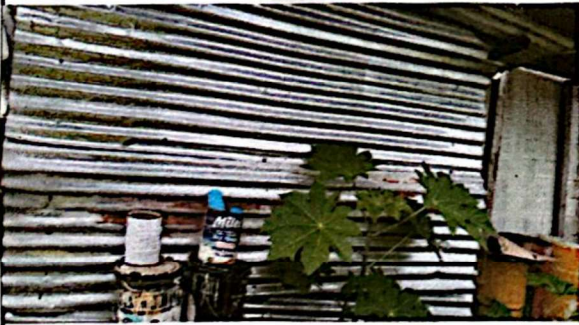
SUMINISTRO Y CAMBIO DE PISO