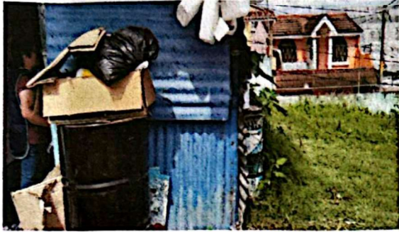
SUMINISTRO E INSTALACION DE MUROS DE BLOCK