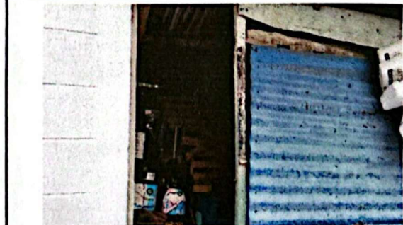
INSTALACION DE VENTANERIA

Observación: Si es necesario se pueden agregar hojas adicionales y actualizar el número de fotos.