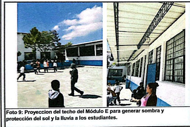
Foto 9: Proyeccion del techo del Módulo E para generar sombra y protección del sol y la lluvia a los estudiantes.