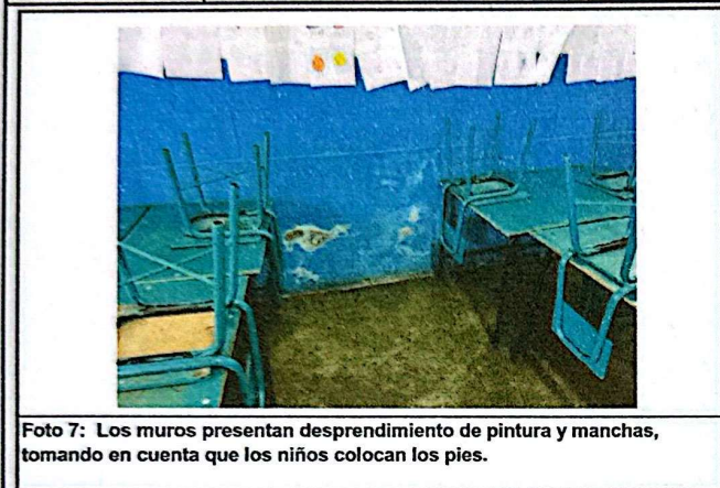
Foto 7: Los muros presentan desprendimiento de pintura y manchas, tomando en cuenta que los niños colocan los pies.