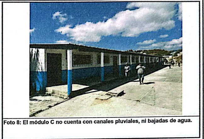
Foto 8: El módulo C no cuenta con canales pluviales, ni bajadas de agua.