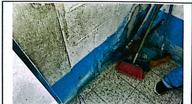
Foto 6: Se muestra el deterioro en la pintura, específicamente del Módulo B tomando en cuenta que es el que más se frecuenta por la existencia de los servicios sanitarios.

Firma y sello del Presidente del Consejo Educativo Primaria, GUATEMALA, C.A.