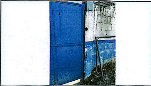
Foto 3: Los anclajes del portón en las columnas representan un peligro, tomando en cuenta el tamaño del mismo y que estos se encuentran expuestos.