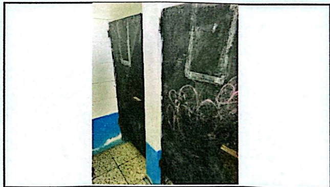
Foto 4: Estado actual de las puertas de los baños, por lo que deben ser intervenidas.