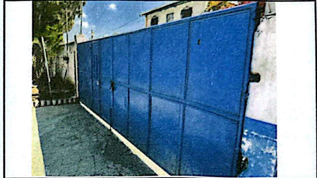
Foto 2: Se deberá realizar el mantenimiento al portón de ingreso, poniendo especial énfasis en el anclaje con las columnas tomando en cuenta que se ha desprendido en repetidas ocasiones.