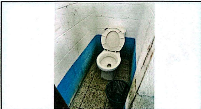
Foto 5: Los inodoros presentan problemas en los accesorios internos y todos se encuentran con la tapadera del tanque quebrada.