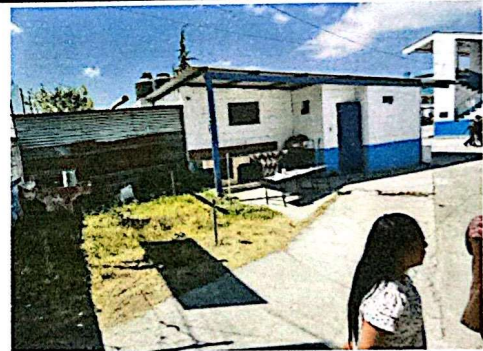
Foto 4: Espacio disponible para ampliación de cocina y poder preparar los alimentos de manera digna.