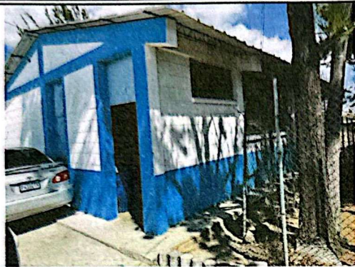
Foto1: . Vista desde el exterior del área de cocina, en el cual se preparan los alimentos para más de 300 estudiantes.