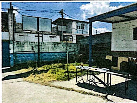
Foto 3: Espacio dispuesto para la ampliación de la cocina, aprovechando parte del muro posterior y la estructura del techo en el área de pila.