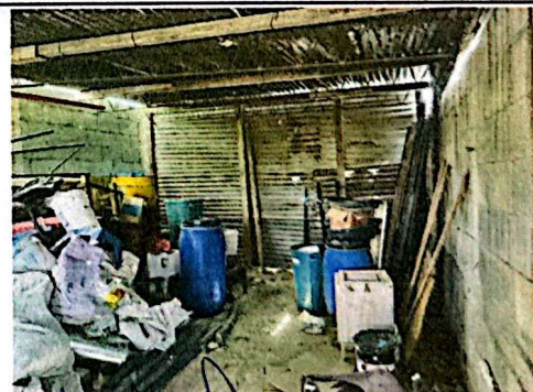
Foto 6: Tomando en cuenta las condiciones no fue posible utilizar el área destinada como ampliación, por lo que de momento se utiliza de bodega.

[Signature] Firma y sello del Presidente de la Comisión