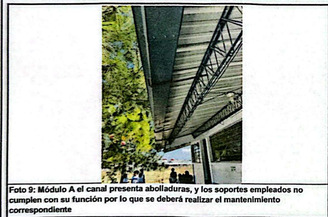
Foto 9: Módulo A el canal presenta abolladuras, y los soportes empleados no cumplen con su función por lo que se deberá realizar el mantenimiento correspondiente