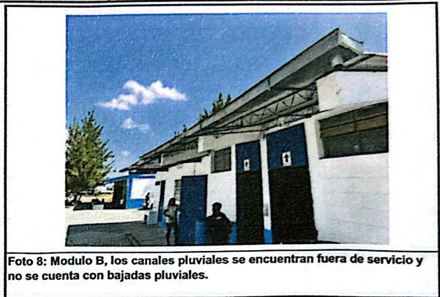
Foto 8: Modulo B, los canales pluviales se encuentran fuera de servicio y no se cuenta con bajadas pluviales.