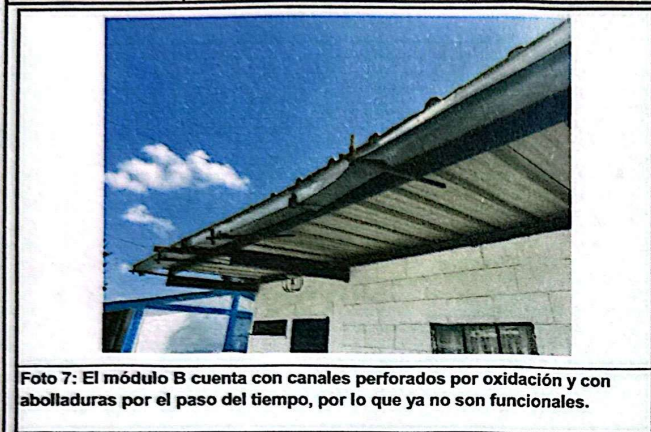
Foto 7: El módulo B cuenta con canales perforados por oxidación y con abolladuras por el paso del tiempo, por lo que ya no son funcionales.