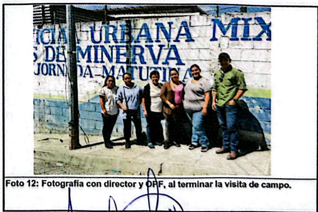
Foto 12: Fotografía con director y OFP, al terminar la visita de campo.