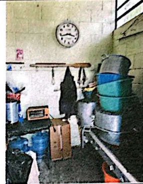
Foto 2: Interior de cocina en el cual muestra el por que la necesidad de tener un nuevo espacio en el cual se pueda cocinar de manera apropiada.