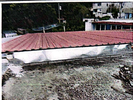
Foto 1: Colocación de Flashing para evitar problemas de filtración.