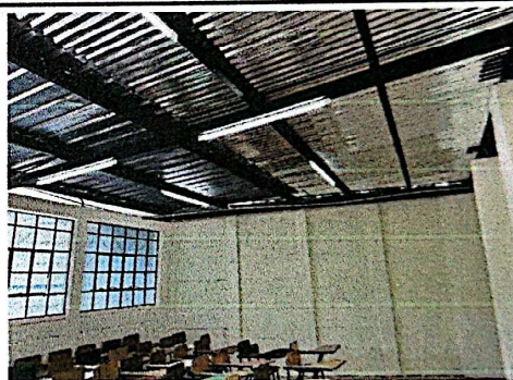
Foto 4: Aplicación de pintura en interior de aulas modulo A + iluminación