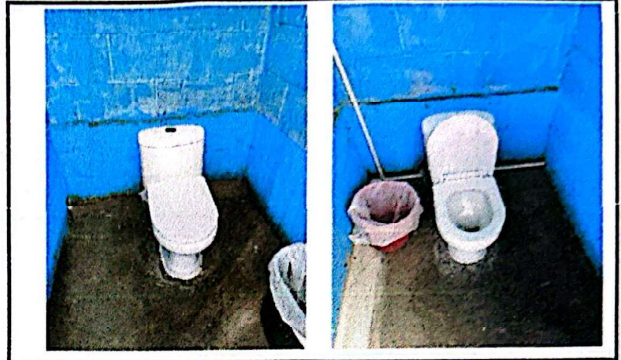
Foto 8: Suministro e instalación de inodoros pequeños para Pre-primaria.