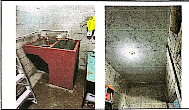
Foto 9: Suministro e instalación de pila + Aplicación de repello y acabado en techo de cocina.