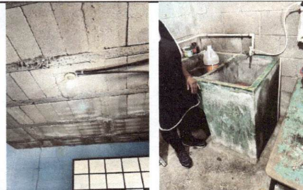
Foto 9: Se encuentra expuesto el sistema de Viguetas y Bovedilla que conforman la losa en el área de cocina, también se aprecia la pila presenta fuga.