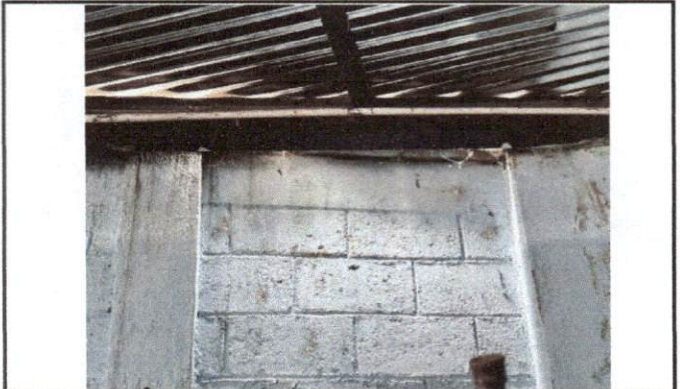
Foto 2: Se aprecia el problema de filtración debido a la mala colocación del techo de lámina en la unión con el muro de block generando humedad.