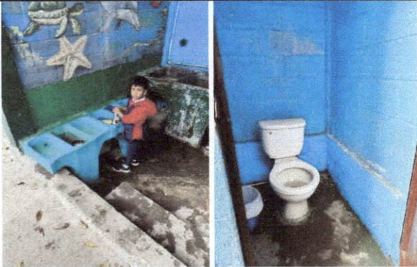
Foto 7: Al igual que la pila, los inodoros deben adaptarse al tamaño de los usuarios, en este caso niños de preprimaria, por lo que se deben sustituir.