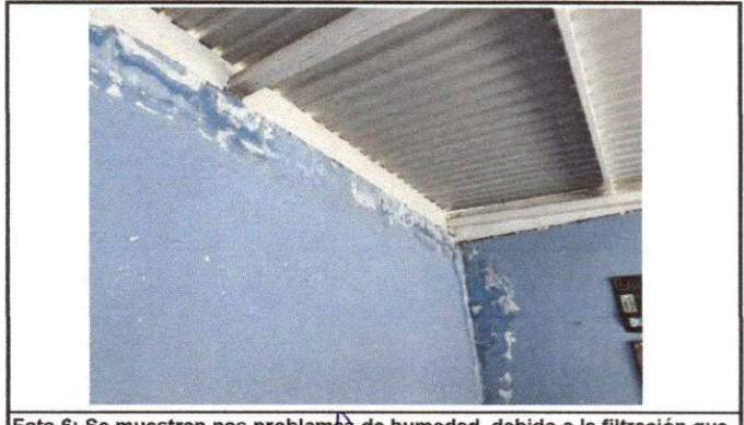
Foto 6: Se muestran nos problemas de humedad, debido a la filtración que existe en la unión del techo el muro.