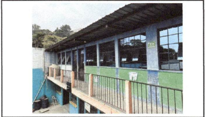
Foto 4: Los vidrios utilizados en los salones, no permiten tener buena iluminación de manera natural.