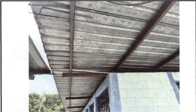
Foto 1: . Problemas de corrosión por falta de Mantenimiento en estructura metálica.