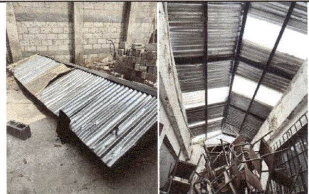
Foto 10: Techo en área de Bodega, por dónde existen problemas de filtración, lo cual humedece los ambientes colindantes.