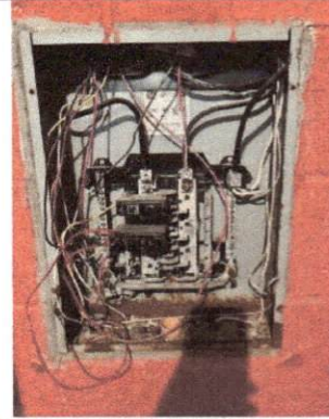
Foto 8: Se muestra las malas condiciones en las que se encuentra el sistema eléctrico del establecimiento.