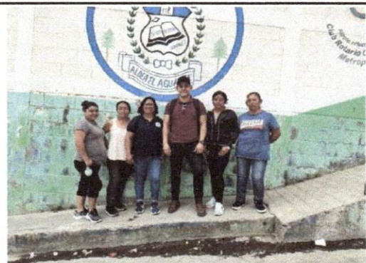
Foto 12: Fotografía con directora y OPF, al terminar la visita de campo.