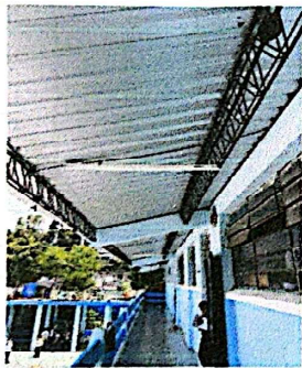
Foto 9: Instalación de nueva red eléctrica, incluye lámparas y cableado.