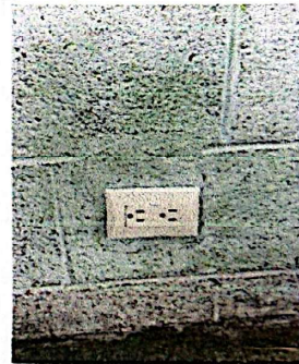
Foto 10: Suministro e instalación de tomacorrientes, incluye cableado.