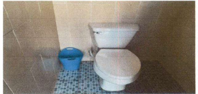
CAMBIO DE 2 SANITARIOS Y ACCESORIOS DE 6 BAÑOS

Observación: Si es necesario se pueden agregar hojas adicionales y actualizar el número de hojas.