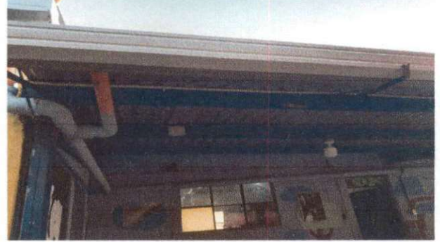
CANALES E INSTALACIONES ELECTRICAS TERMINADOS