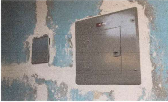
CAMBIO DE CAJA DE DISTRIBUCION TERMINADA