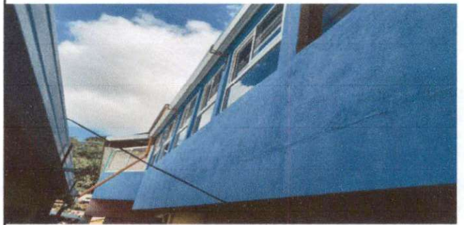
COLOCACION DE VENTANAS 2DO NIVEL