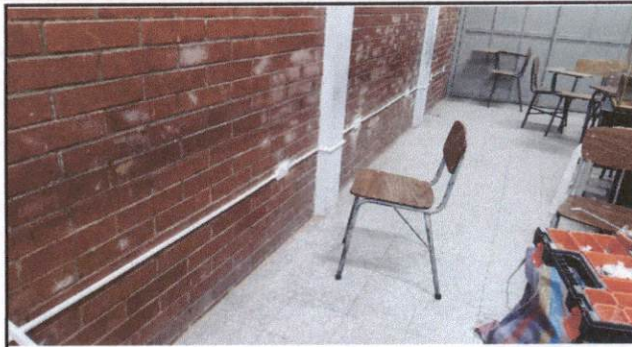
Foto 2: Área de comercio, reparación de instalación eléctrica e implementación de nuevos tomacorrientes para ampliación del laboratorio de TACS.