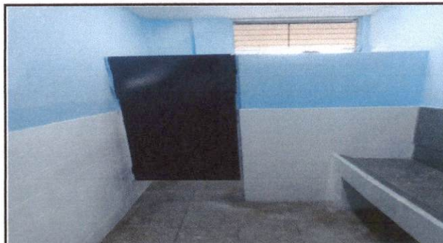
Foto 4: Mejoramiento y reparación de mingitorio, tubería de agua potable, azulejo, puertas, cambio de lavamanos y pintura en servicio sanitario de alumnos.