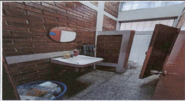
Foto 7: Área de baños docentes, existe una fuga que perjudica tanto el servicio de mujeres como de hombres, lo que mantiene humedad en el área.