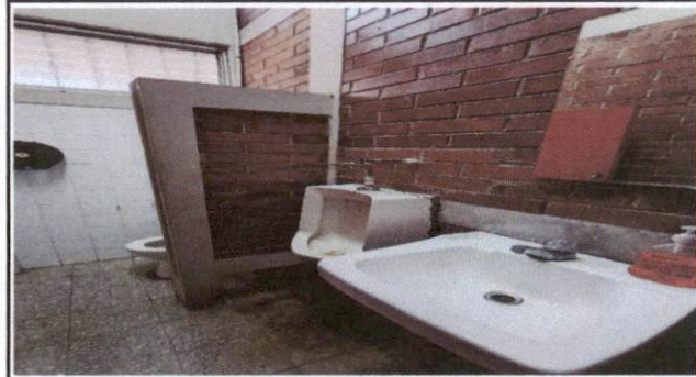
Foto 8: Se necesita reforzar los lavamanos para que funcionen correctamente y no exista riesgo de que estos se caigan.