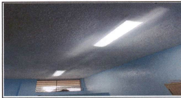
Foto 6: Reparación de instalación eléctrica e implementación de lámparas LED en servicios sanitarios de los estudiantes.

Observación: Si es necesario se pueden agregar hojas adicionales y actualizar el número de hojas.