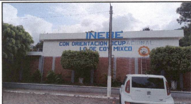
Foto 1: Frente y entrada del Establecimiento INEBE Con Orientación Ocupacional Jornada Vespertina, pintura de las letras del nombre del establecimiento y logos.