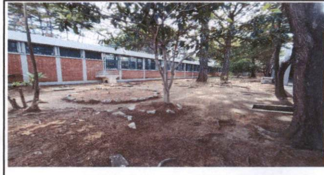
Foto 10: Gracias a que contamos con espacio para implementar mesas de descanso, los alumnos podrán contar con un área adecuada para ingerir sus alimentos.