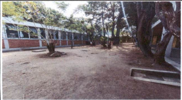
Foto 9: Los alumnos no cuentan con un espacio adecuado para que se sienten a ingerir sus alimentos, se necesita implementar mesas de descanso.