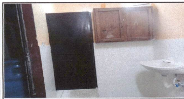
Foto 5: Mejoramiento de sanitarios, tubería de agua potable, azulejo, puertas, cambio de lavamanos y pintura en servicio sanitario de alumnas.