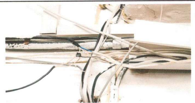
Imagen de cableado que necesita entubado

Observación: Si es necesario se pueden agregar hojas adicionales y actualizar el número de hojas.