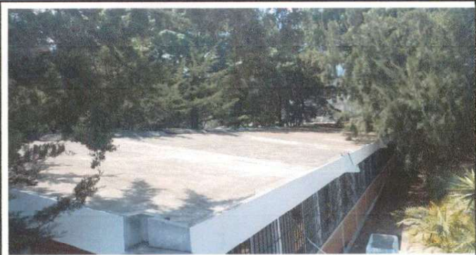
Imagen de modilo donde se haran los trabajos de impermeabilizacion.