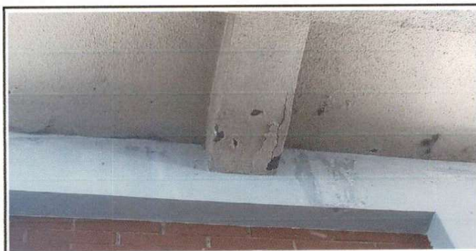
Imagen de Viga por reparar, ubicada en pared al ingreso del SUM