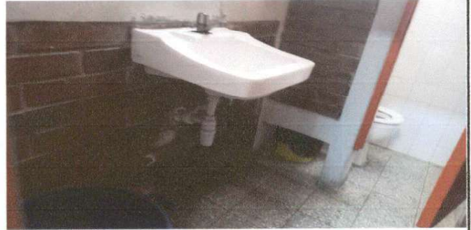
Imagen de filtración de agua