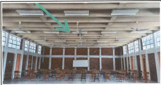
Imagen de Viga horizontal por reparar, ubicada la centro del SUM

Observación: Si es necesario se pueden agregar hojas adicionales y actualizar el número de hojas.