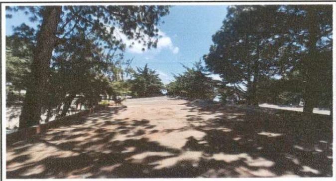
Imagen de area a trabajar, por un total de 400 MT.