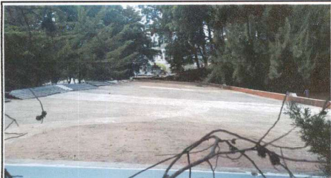
Imagen de losa de modulo 2, donde se muestra la imagen donde se encuentran reparaciones.