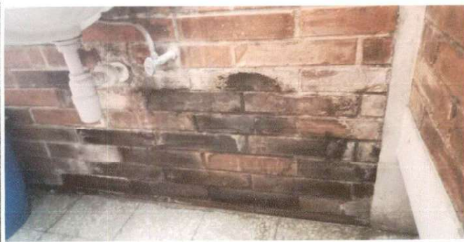
Imagen de grietas donde se filtra agua.