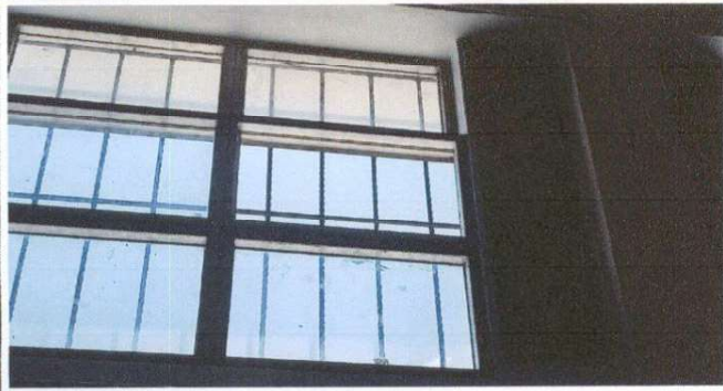
Imagen de ventanas para cambio de vidrios