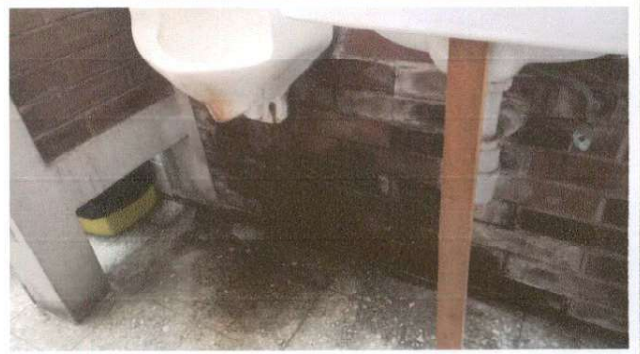
Imagen de fuga de baños de area de administracion por reparar