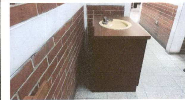
Imagen de area de instalación de lavamanos en area administrativa