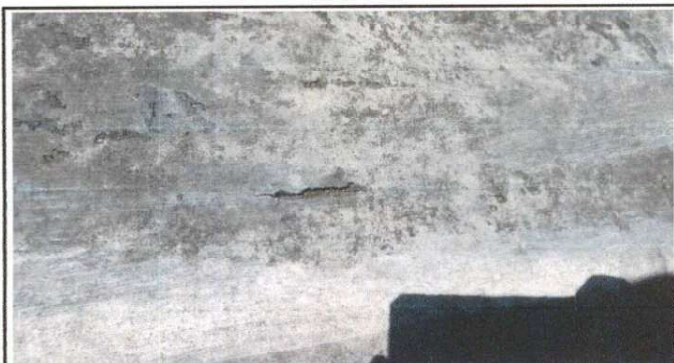
Imagen de grietas donde se filtra agua.