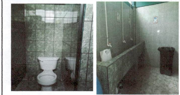
Foto 1: Reparación de baños, colocación de azulejos y pileta para lavarse las manos.