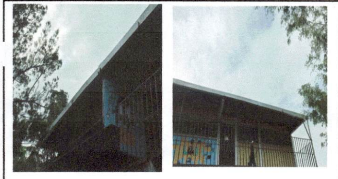
foto 3 Reparación y colocación de canal y bajada de agua de 3 salones 2do. Nivel.