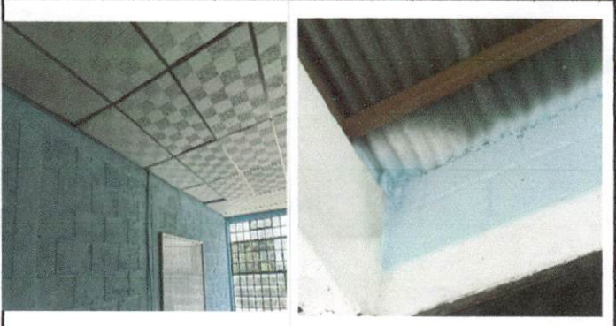
Foto 2 Reparación de techo y ventanas de salones del 2do. Nivel.