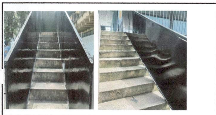
foto 5 Pintura exterior y subida hacia los salones del segundo nivel.