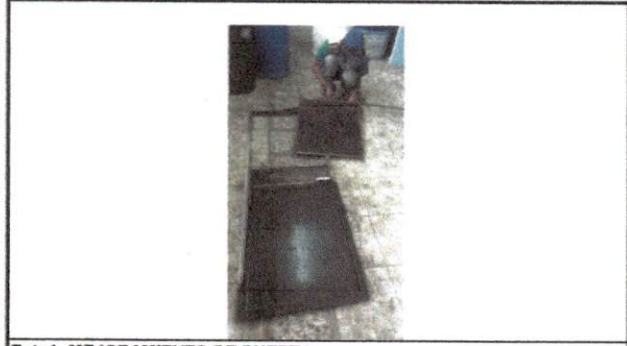
Foto1: MEJORAMIENTO DE PUERTA