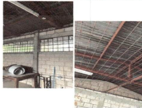
foto 6 Necesidad de Cielo falso, reparación de ventanas e instalación de aire acondicionado para el salon de exprsion artística en el segundo nivel.

Observación: Si es necesario se pueden agregar hojas adicionales y actualizar el número de hojas.