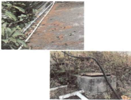
foto 3 Reparación de suministros de agua potable para los baños, durante años hemos tenido esta problemática con la conexión del agua en la jornada vespertina.