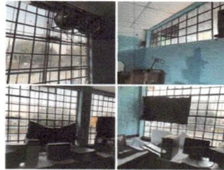
foto Necesidad de instalación de vidrios quebrados, reparación de ventanas e instalación de aire acondicionado en los salones de computación y expresión del segundo nivel de nuestro establecimiento.