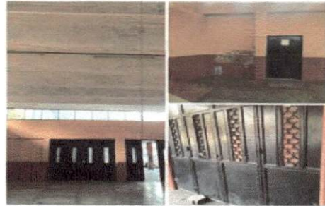
Foto 2 Reparación de portón y sistema eléctrico de SUM de nuestro instituto durante años hemos contado con una pésima iluminación y un acceso en mal estado.