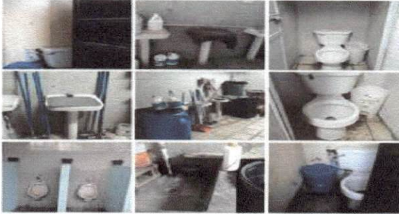
Foto 1 Pésimo estado de los baños, lavamanos, urinarios y bajada de agua en sanitarios de los alumnos y alumnas, necesita reparación completa.