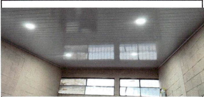
Foto 1: imagen que muestra el estado actual del cielo falso afectado por la filtración agua pluvial en el area administrativa .