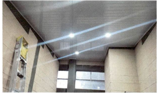
Foto 2: Imagen que muestra el estado actual lateral del módulo administrativo