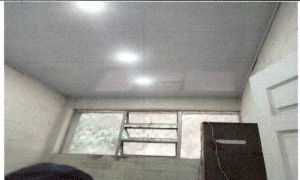
Foto 4: imagen que muestra el estado actual de la instaciones eléctricas del corredor del establecimiento