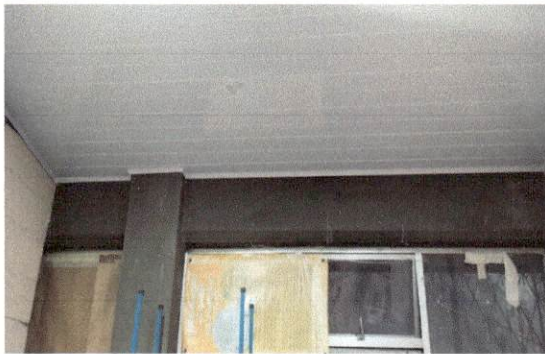
Foto 3: Imagen que muestra el estado actual del cielo falso afectado por la filtración de agua pluvial en área administrativa