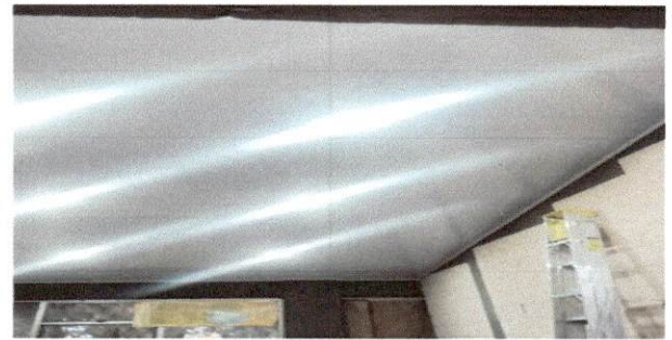
Foto 6: Imagen que muestra el estado actual lateral del modulo administrativo afectado por la filtración de agua pluvial

Observación: Si es necesario se pueden agregar hojas adicionales y actualizar el número de hojas.