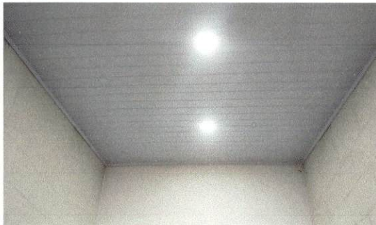
Foto 5: Imagen que muestra el estado actual de duralita afectado por la filtración de agua pluvial en área administrativa