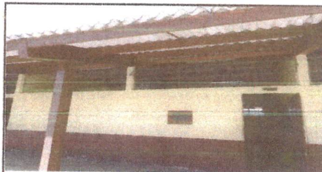
Foto 6: Exterior del techo, aula de 5to B y costaneras del corredor.

Observación: Si es necesario se pueden agregar hojas adicionales y actualizar el número de hojas.