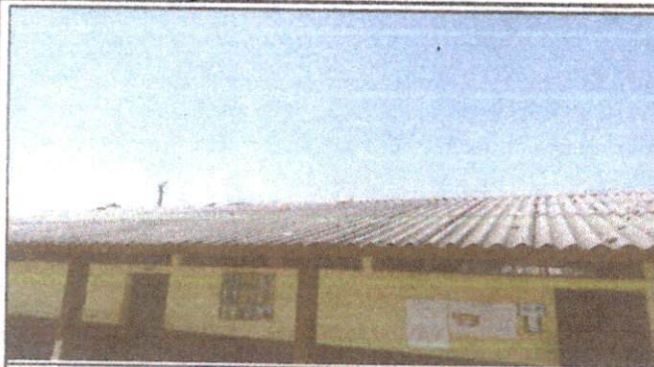
Foto1: Techo del aula de 1ro C y 2do B exterior.