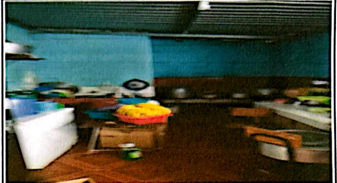
Foto 2: Esta es otra imagen donde se evidencia el mal estado de la pila, el lugar esta cerrado, no tiene ventilación. Muestra el azulejo en el fondo, necesita ampliarse.