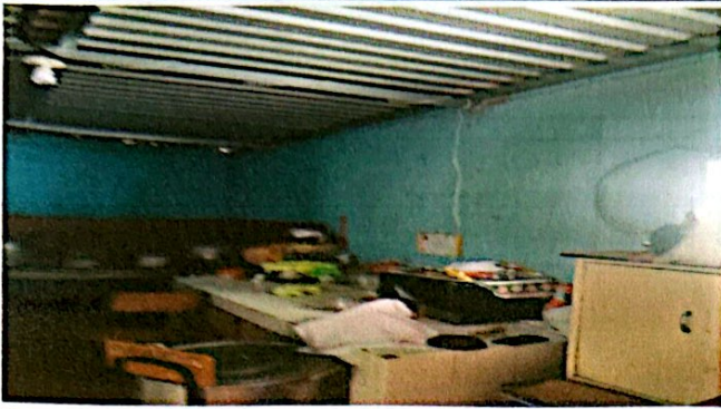
Foto 1: En esta imagen se muestra el estado de la cocina. Se puede ver el estado de la pared, el lugar donde se cocina el azulejo está deteriorado.