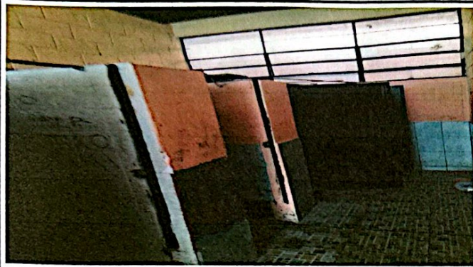
Foto 3: Esta imagen evidencia el mal estado del azulejo de los baños, las puertas están dañadas y en la pared se observa que parte del azulejo se ha caído.