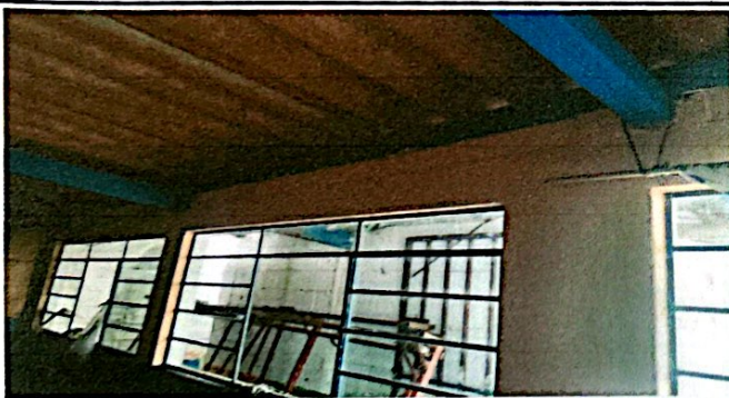
Foto 5: Esta imagen evidencia el estado de este salón, los ventanales están deteriorados, el techo de igual forma está totalmente deteriorado.