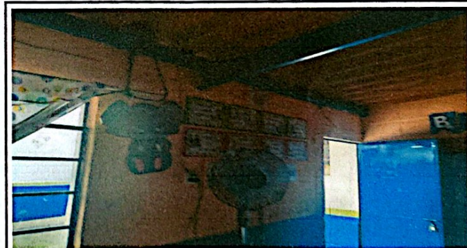
Foto 6: La imagen muestra parte del salón de clase que se encuentra deteriorado, los ventanales están deteriorados, quizá no se observa pero el salón el techo lo tiene muy bajo y hace demasiado calor.

Observación: Si es necesario se pueden agregar hojas adicionales y actualizar el número de hojas.